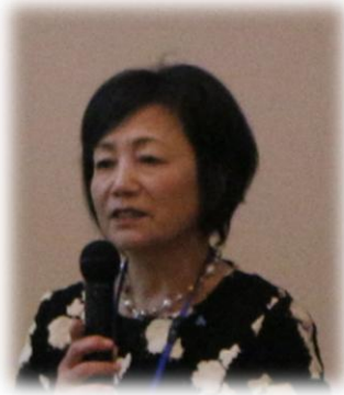
挨拶 夏山厚生副部長