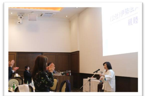
閉会挨拶 世古厚生委員長