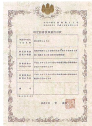
特定信書便事業許可状