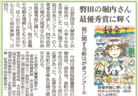
▲令和7年12月26日付中日新聞（中東遠版）掲載