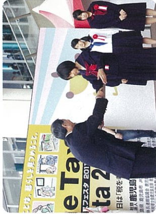
サ・タックスフェスタ