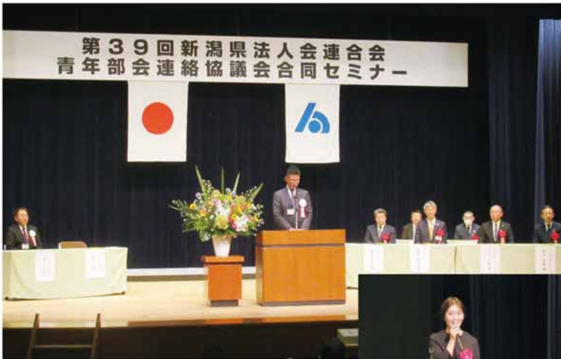
県連青年部会合同セミナー式典