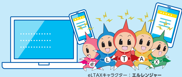
eLTAXキャラクター：エルレンジャー