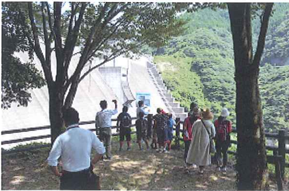
竜門ダムの水系の説明