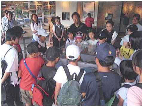
(竜門ダムで説明を聞く子供達)

署長室では人生初の署長と名刺交換を体験、その後1億円を抱えてみたり、署長席に座って記念写真を撮ったりしました。