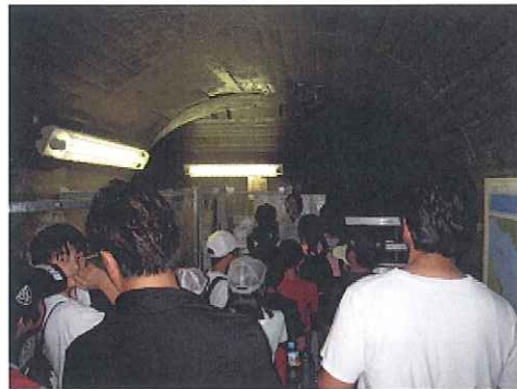
(ダム内トンネルで説明を聞く子供達)