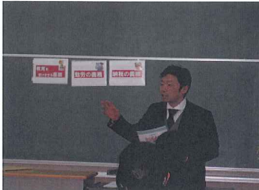
H31. 2. 5 (火) 菊陽南小学校 (菊陽)