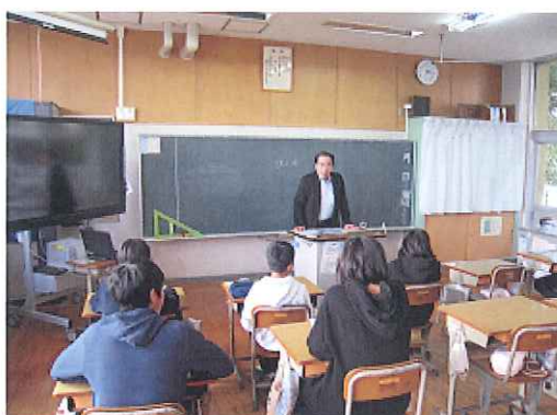
H31. 2. 1 (金) 西合志第一小 (合志)