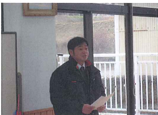
H31. 2. 2 (土) 旭志小学校 (菊池)