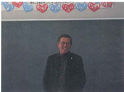
H31. 1. 25 (金) 室小学校 (大津)