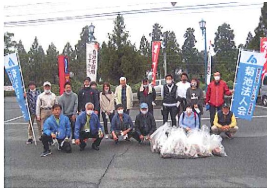
戦利品（ゴミ）の前で・・・