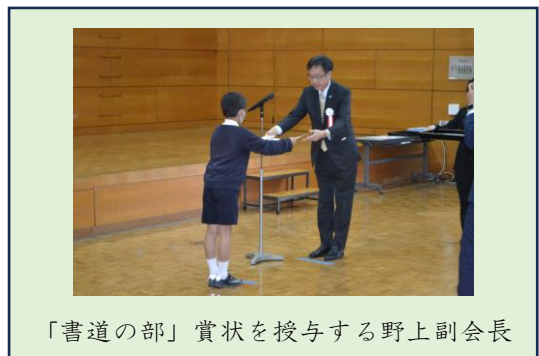
「書道の部」賞状を授与する野上副会長