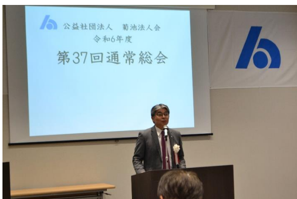
挨拶する加茂野会長

そして、令和6年度は、法人会とは・・・を会員の皆様が理解して頂き、楽しみながら活動を進めていきたい旨の決意表明もなされました。