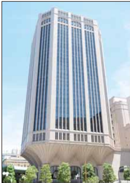
大同生命大阪本社ビル(大阪市西区江戸堀) ~加島屋が店を構えた地に建つ~