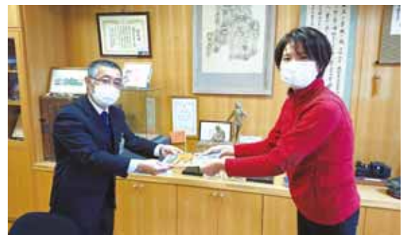
税に関する絵はがきコンクール応募の お願いをする土原副部長（大桑小学校）

ました。この事業はこれからも租税教育事業ならびに地域社会貢献事業として、毎年継続して実施してまいります。