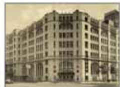
旧肥後橋本社ビル (設計:W・M・ヴォーリス)