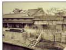
大同生命の礎を築いた 大坂の豪商“加島屋”