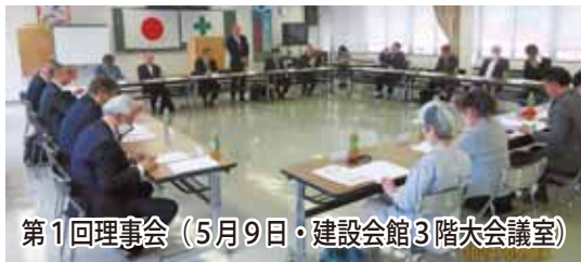
第1回理事会（5月9日・建設会館3階大会議室）