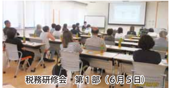
税務研修会 第1部（6月5日）