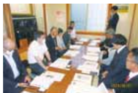
挨拶する上越部長

上越青年部長からの新年度の事業計画において行事の積極的参加など、会員の結束と連携強化を確認しました。