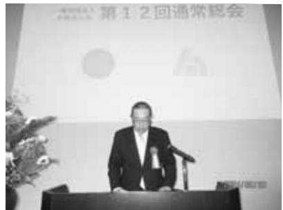
通常総会で挨拶する 三田村税務署長