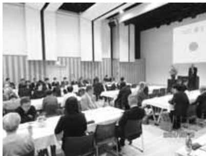
5月29日 第12回通常総会 木曾町文化交流センター多目的ホール