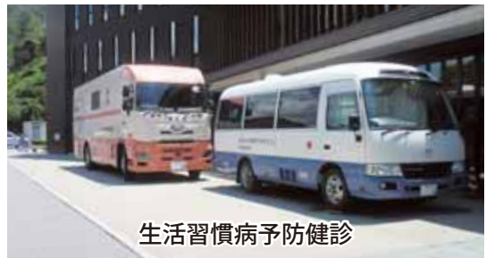
生活習慣病予防健診