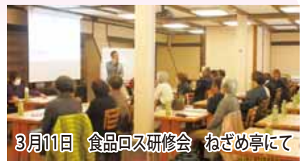
3月11日 食品ロス研修会 ねざめ亭にて

全法連女性部会で始まりました食品ロス問題の取り組みに、木曾法人会では、まずはじめに「食品ロスについて、理解を深めよう」をテーマに3月に県社会福祉協議会や地域で取り組みをされておられる方を講師としてお招きして研修会を行いました。