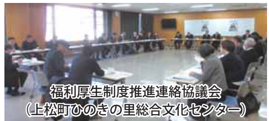
福利厚生制度推進連絡協議会 （上松町ひのきの里総合文化センター）