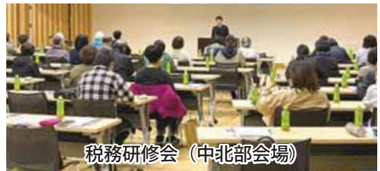
税務研修会（中北部会場）