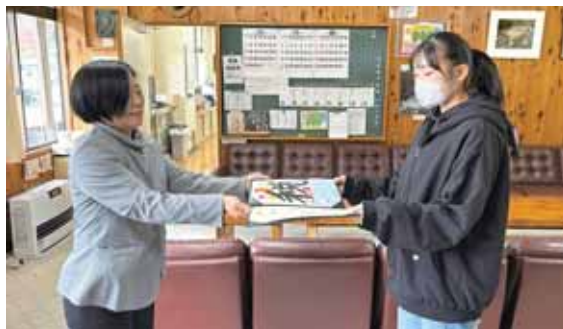
佳作入選者の木祖小学校児童と小林副部長

佳作で入選された児童の皆さんに、法人会女性部役員が各小学校へ賞状を授与に行っていました。