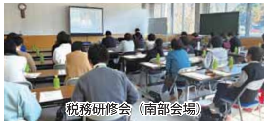
税務研修会（南部会場）