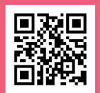
▲キャンペーン専用ページ