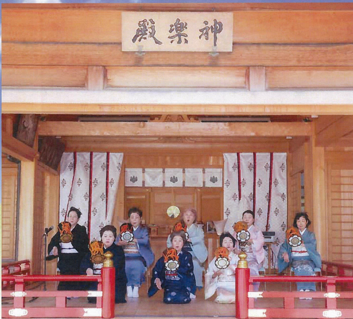
足立山妙見宮春季例大祭 鼓奉納演奏

発行者 公益社団法人 小倉法人会 広報委員長 坂本 秀樹 北九州市小倉北区紺屋町13-1 TEL(093)511-5283 FAX(093)511-5259