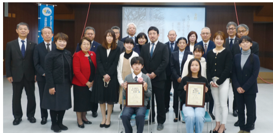
小倉南区徳力桜橋横広告塔除幕式

絵はがきと同じく租税教室の開催を実施した小学6年生及び小倉間税会と共同して中学校4校の生徒に、税に対する関心を高め、納税者としての自覚を促すことを目的に、「税に関する標語」を募集した結果、2,859作品の応募があり、女性部会メンバーによる選考会で優秀作品14作品を選定しました。