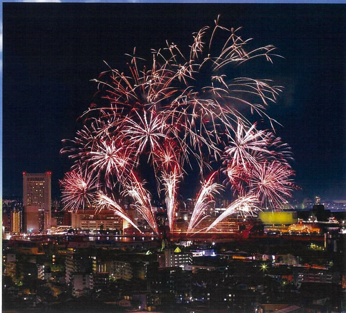
わっしょい百万夏まつりミクニスタジアム花火

発行者 公益社団法人 小倉法人会 広報委員長 坂本 秀樹 北九州市小倉北区紺屋町13-1 TEL(093)511-5283 FAX(093)511-5259