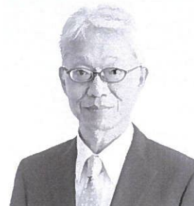
代表取締役 社長執行役員