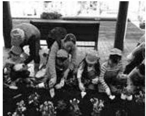
せんばミニパーク花植え運動 (一新支部)