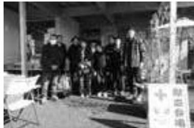
【厚生委員会・青年部会協力スタッフ】