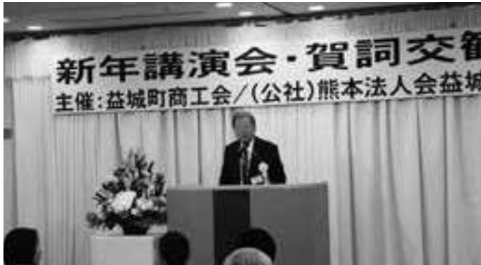
賀詞交歓会 (益城町支部)