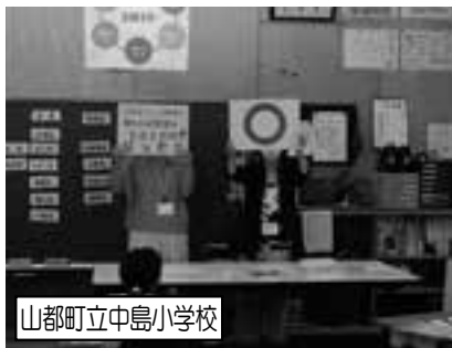
山都町立中島小学校

いつも買い物をしている時、なんでいつも消費税があるのかな？と思っていて、消費税なんてなければいいのにと感じていました。でも、今日のDVDなどをみて、消費税なんてなくなればいいという考えを見なおしました。これからも自分で税金について学んでいこうかなと思いました。今日は、麻生田小学校にきて、いろいろなお話をさせていただいてありがとうございました。