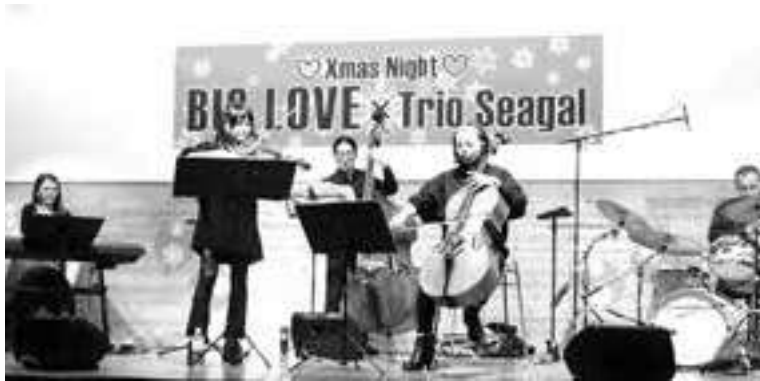
クリスマス音楽コンサート (流通団地支部)