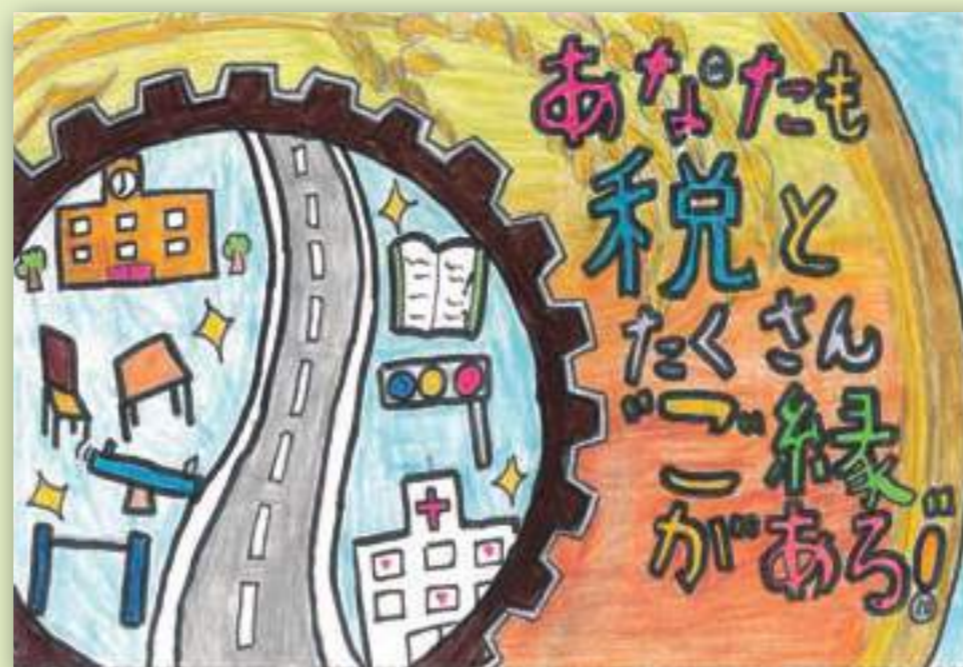
長嶺小学校 一 恵那 熊本東 税務署長賞