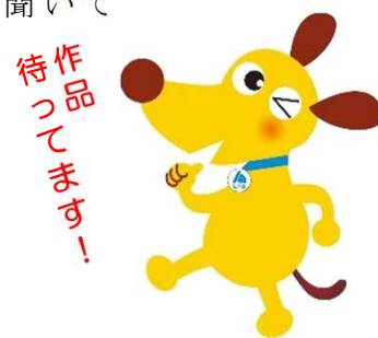
法人会キャラクターけんた