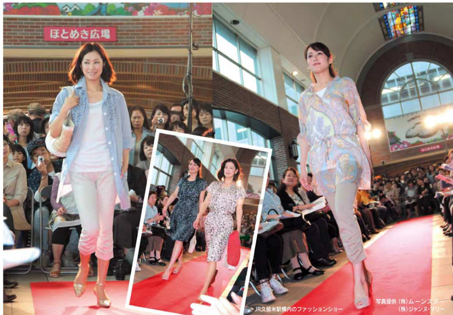
JR久留米駅構内のファッションショー