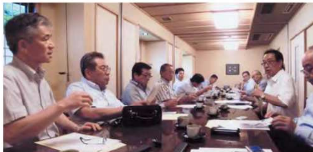
組織の充実、会員増強の推進など討議されました。