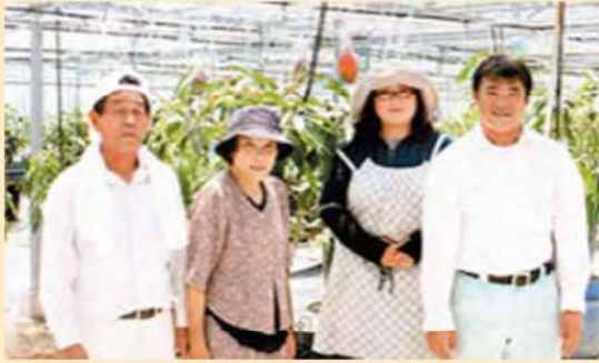
哲郎社長(左)夫妻と荘哉専務(右)夫妻