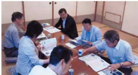
夏のかっぱ通信会報誌の編集会議が行われました。