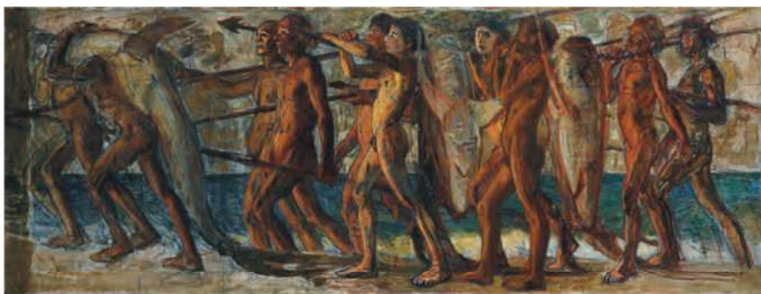
青木繁(1882-1911) 海の幸 1904年(明治37年) 油彩・カンヴァス 重要文化財

石橋美術館は、1956(昭和31)年4月26日、石橋文化センターの中心施設として開館しました。株式会社ブリヂストン創設者の石橋正二郎(1889-1976)が蒐集した作品を核とするいわゆる石橋コレクションのうち、石橋美術館で展示されている作品を藏品図録『石橋美術館名作選』(2010年、石橋財団石橋美術館発行)からご紹介します。