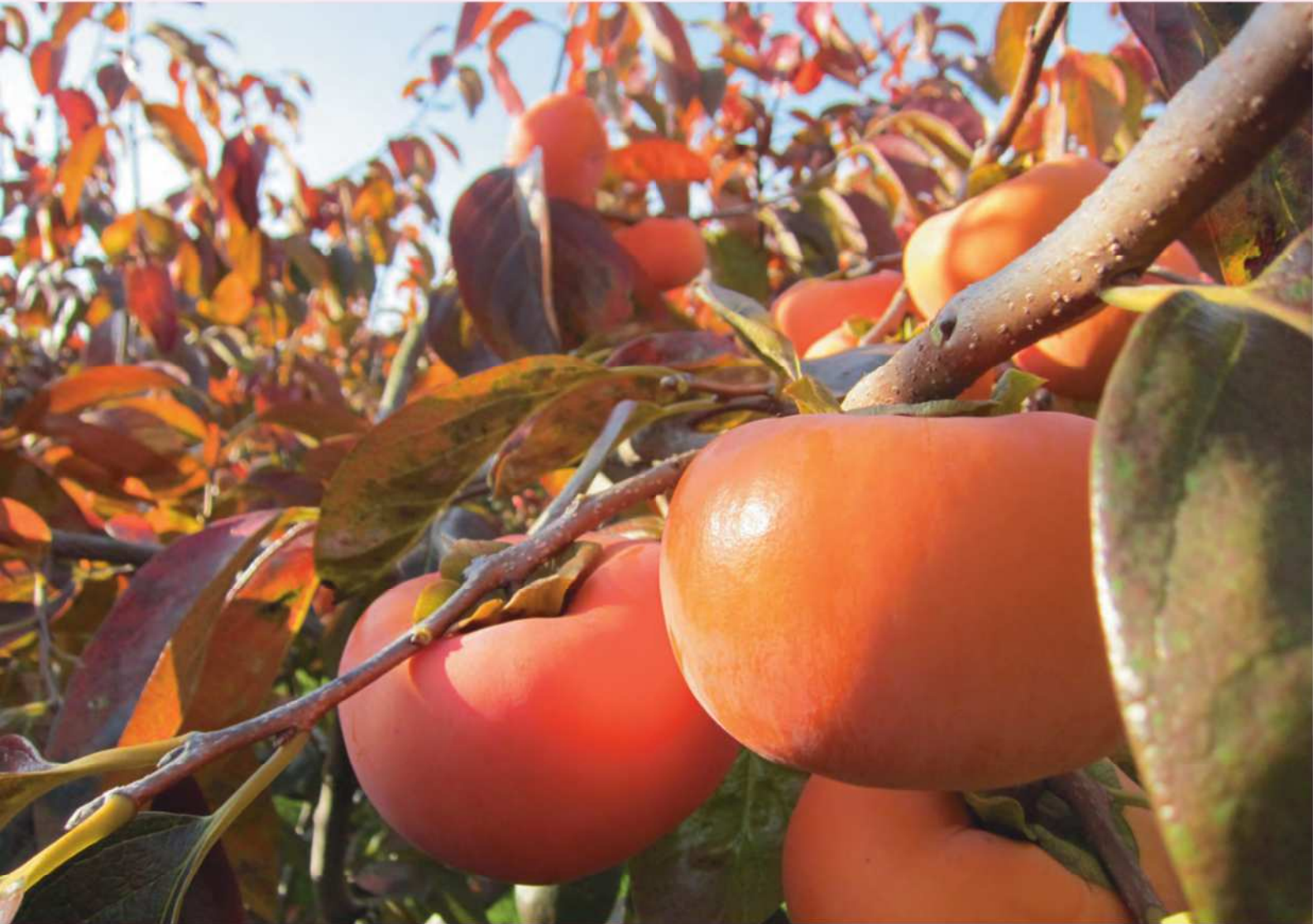
秋の味覚 うきはの柿