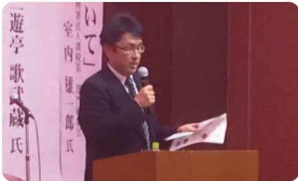
久留米税務署 室内統括官