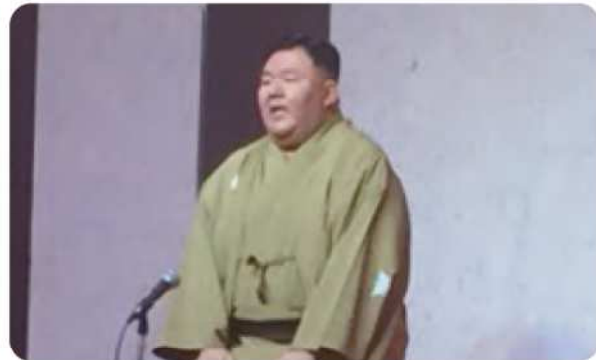
三遊亭歌武蔵師匠