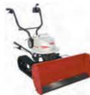
電動除雪機電子制御部