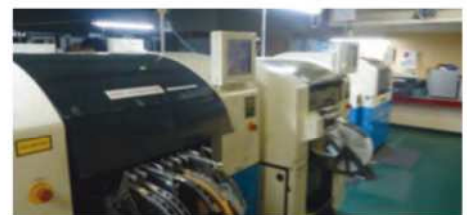
ヴァンテック社内実装機

現在は、今までの開発・製造の経験を生かし遠隔操作システム／LED表示器／生産管理システムの3モデルを自社商品として開発中です。今後もお客様のお役に立てるよう、日々技術力の向上に努めて参りますのでご興味のある方は、右記までご連絡お待ちしております。