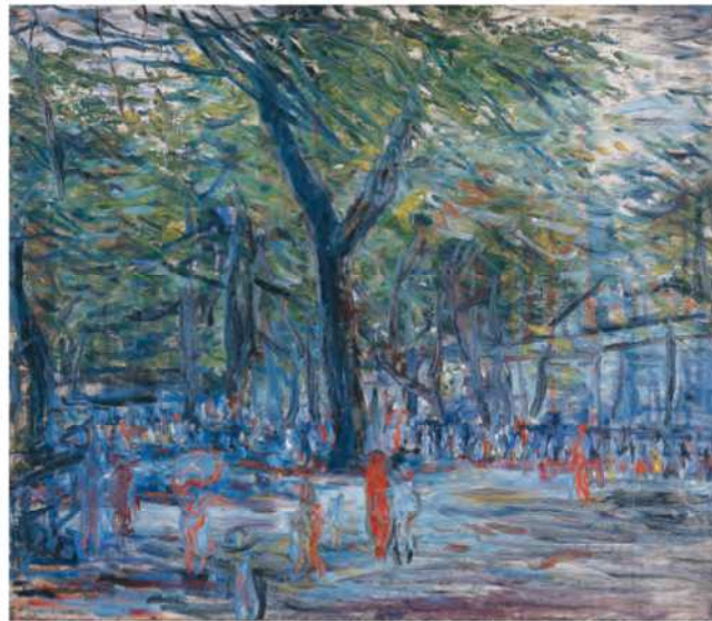
長谷川利行(1891~1940) 動物園風景 1937年頃(昭和12年頃) 油彩・カンヴァス

制作年については、1937年の前後数年の幅をもって想定すべきと考えられます。この時期の長谷川の作品は、貧しさと蝕まれた健康状態もあって、カンヴァスに塗られる絵の具の色数も量も少なく、速筆の線を主とした即興的な作品が多い中で、この作品では比較的絵の具がたっぷり使われていて完成度が高いことが注目されます。長谷川は自らが生きた東京の街、とりわけ浅草や上野界隈を多く題材として絵を描きました。彼は一つ所に定住することはなく、晩年は、酒を飲み、絵の具箱を抱えて夕暮れまで歩き回っては木賃宿に帰るといふ生活を送っていたようです。この絵からも画家の孤独感が伝わってくるようです。