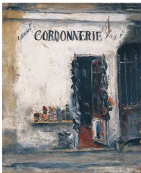
佐伯祐三(1898-1928) コルドヌリ(靴屋) 1925年(大正14年)