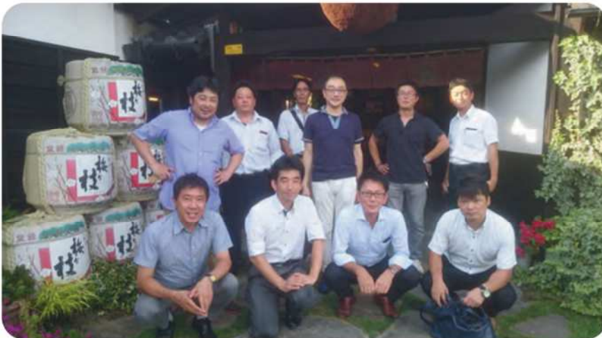
梅ヶ枝酒造(株)にて