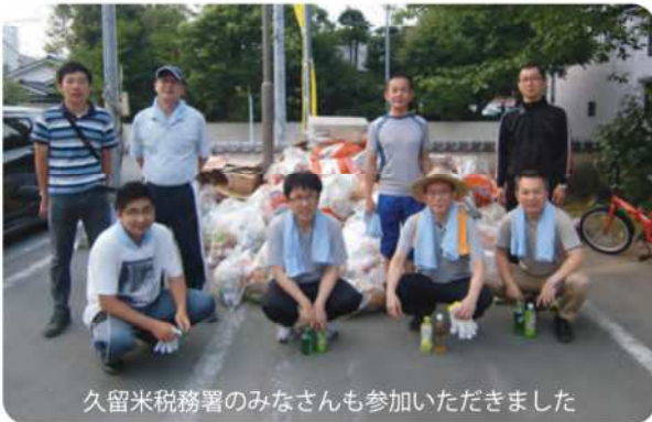
久留米税務署のみなさんも参加いただきました

久留米法人会は、公益法人活動の大きな柱として「社会貢献活動」を実施しています。今後も、さらに地域に密着した活動を模索していくことが課せられています。