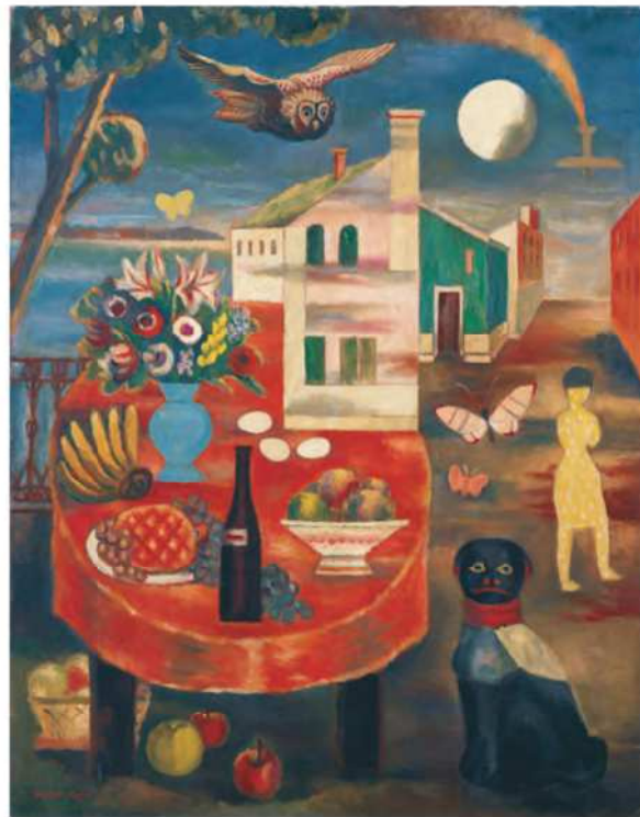
古賀春江(1895~1933) 素朴な月夜 1929年(昭和4年) 油彩・カンヴァス

月夜であると同時に、画面左奥には明るい空。夜行性の梟と、蝶。テーブルには、果物や卵、酒瓶、花の生けられた花瓶、そしてなぜか建物の一部。右奥から手前までつながる地面は、ここを屋外かと思わせませんが、左端に隠れたバルコニーの柵が室内であることを示します。夜か、朝か、はたまた屋外か、屋内か、描かれた光景を限定できない要素が多く、読み解こうとすると一筋縄ではいきません。ひとつひとつは現実が存在するモチーフですが、脈絡のない並置や奇妙な配置で幻想的な世界を表す手法には、西欧の新潮流シュルレアリスムとの関連が当時から指摘され、東郷青児や阿部金剛、中川紀元らの作品と共に、その作風は二科展で注目を集めました。