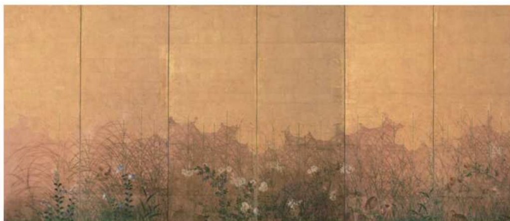
武蔵野図屏風 江戸時代(17世紀) 紙本金地著色

中央にそびえる主山から視線を移すと、春には梅を、夏に滝、秋に紅葉樹、冬は雪山、そして、それぞれに高士の姿を見出します。細部を見て、また全体を見ると、さまざまな色がほどこされているのに気づき、この四幅対の絵が内容的にも色彩的にも豊かな山水図であることがわかります。雪舟は山水図を多く描いていますが、そこには自然と人との関わりが内包されており、理想郷的空間が築かれています。この絵を制作するにあたって、雪舟が手本としたと思われる作品が近年報告されました。中国明時代の《四季山水図》(九州国立博物館)と、伝閩次子の《鏡湖帰棹図冊》(台北・故宮博物院)です。絵の制作背景を見直す上で、貴重な機会となりました。