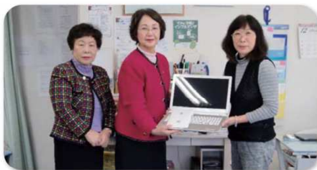
【平成27年12月16日(水)】 NPO法人つながろう・アースフレンズ 「不思議の国のアリス」へ「パソコン」を寄贈