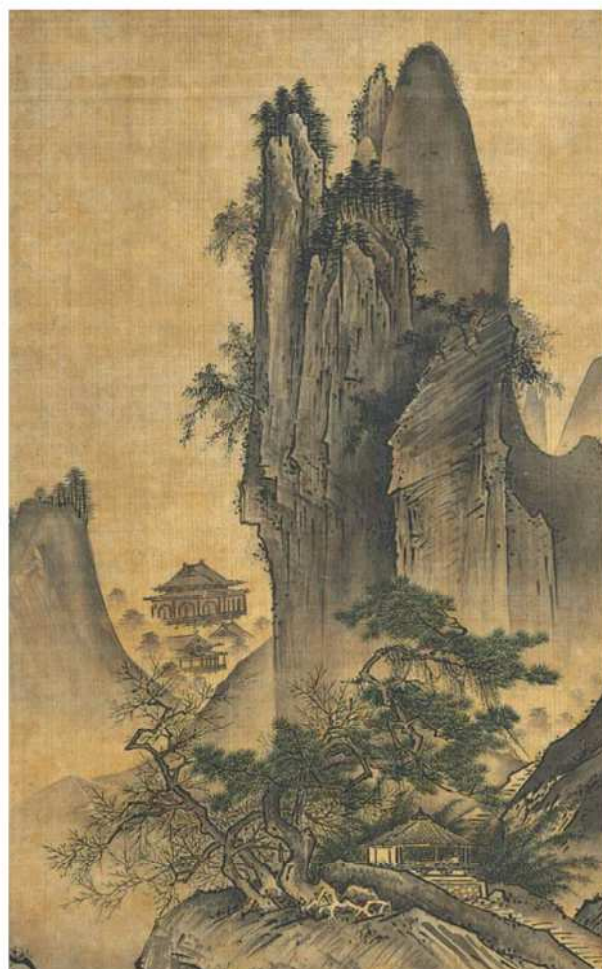
雪舟 (1420-1506?) 四季山水図(四幅のうち春幅) 室町時代(15世紀) 絹本墨画淡彩