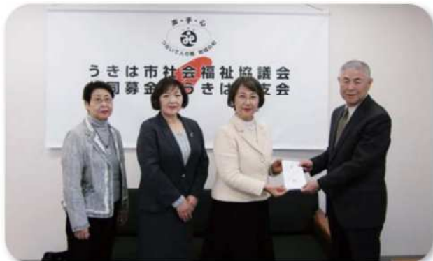
【平成27年12月9日(水)】 うきは市社会福祉協議会へ 「カンバッチ作製機、卓上シーラー」を寄贈