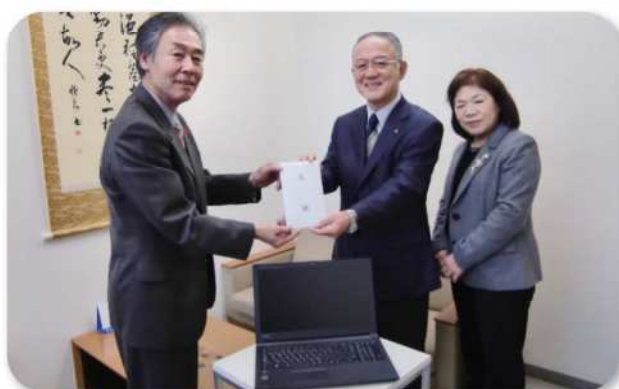
【平成27年12月11日(金)】 小郡市社会福祉協議会へ「パソコン」を寄贈