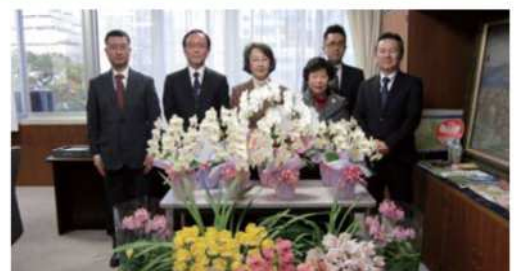
税務署のみなさんと記念撮影

女性部会では久留米税務署の確定申告会場へ花鉢を寄贈しています。待ち時間に少しでも和んでいただければ・・・