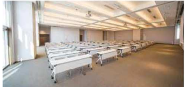
会議室(大会議室、中会議室、小会議室)