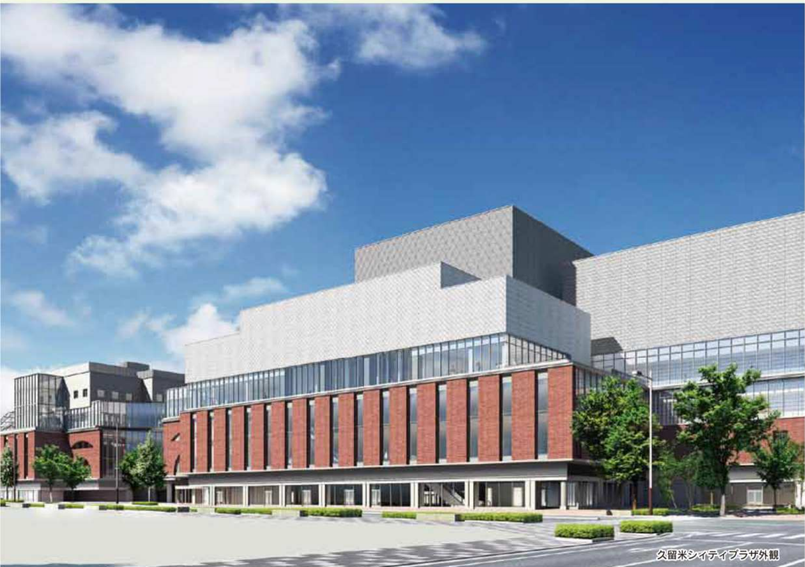
久留米シティプラザ外観