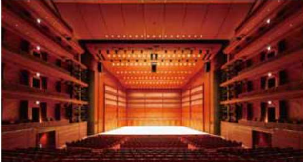
ザ・グランドホール

久留米シティプラザは、大中小3つのホールと会議室、展示室、スタジオ、全天候型広場である「六角堂広場」、憩いのスペースである「六ツ門テラス」、さらに本格的な和室「長盛」や交流スペース「カタチの森」から構成されています。これらが2つの街区に渡って配され目的に応じて多種多様な使い方ができるほか、全館を活用したコンベンションの利用も可能です。1階にはショップやレストランが入り、地下には114台収容の駐車場も完備しています。