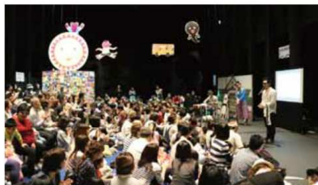
tupera tuperaワークショップの様子