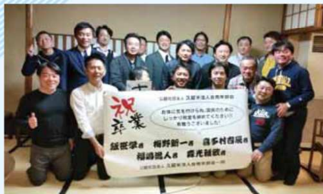
平成28年4月12日(火)~13日(水) 追い出し研修会 京都にて