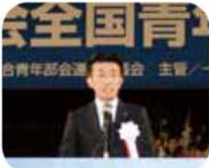
全法連青連協 醍醐会長

去る、9月8日、9日に旭川市で開催された、全国青年の集い「北海道大会」に参加しました。