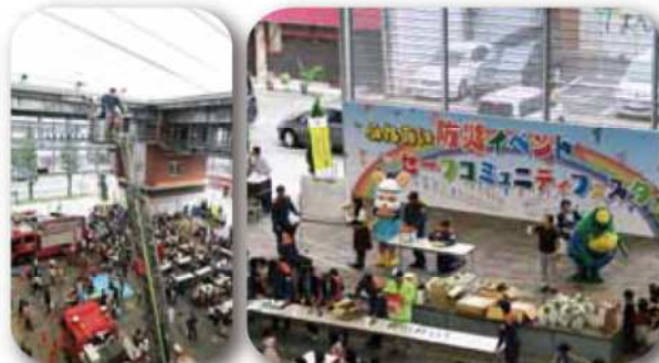
六角堂広場 2016年10月8日(土) ふれあい防災イベント・セーフコミュニティフェスタ同時開催