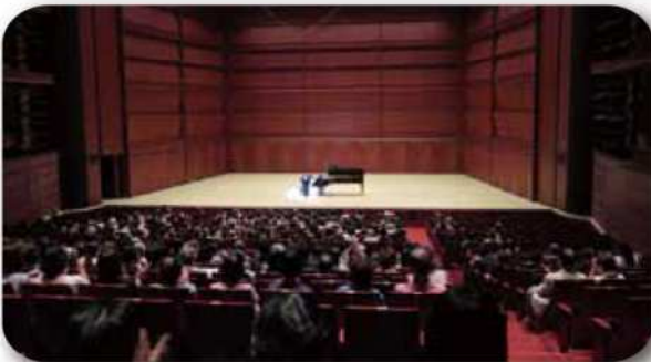
ザ・グランドホール 2016年5月28日(土)開催 2つのピアノ聴きくらべ～久留米のひびき～

従来の久留米市民会館、旧六角堂広場では、年間の来館者数を併せると約31万人でしたが、久留米シティプラザでは2016年8月末時点で、来館者数20万人を突破しました。開館初年度の目標である61万2,800人を達成すべく、今後も関係各所との連携を図りながら、たくさんの方にご来館いただける利用しやすい施設を目指してまいります。