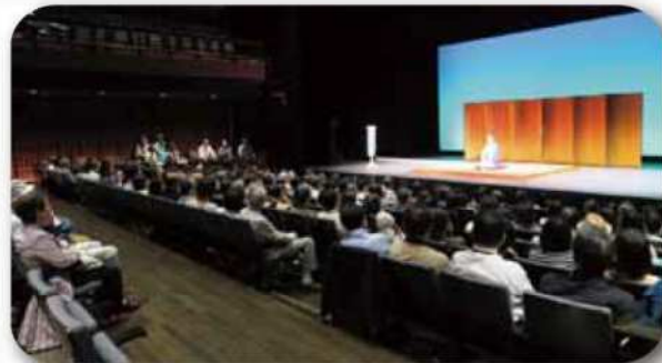
久留米座 2016年7月9日(土) こめらく亭～三三が江戸前をお届けします ※江戸落語の寄席