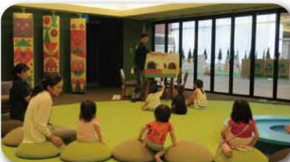
カタチの森 夏休み企画 絵本読み聞かせ