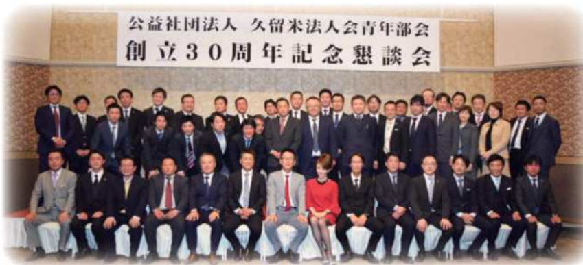
公益社団法人 久留米法人会青年部会 創立30周年記念懇談会