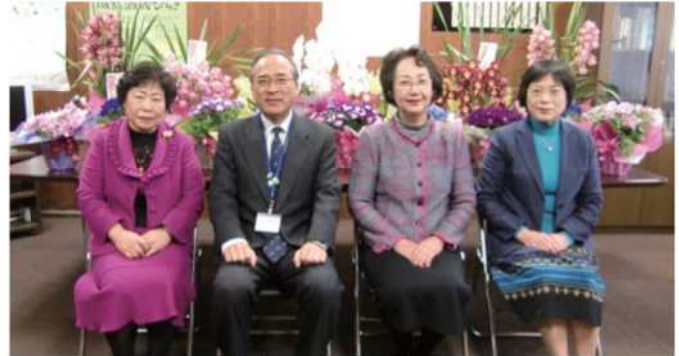
税務署長と記念撮影