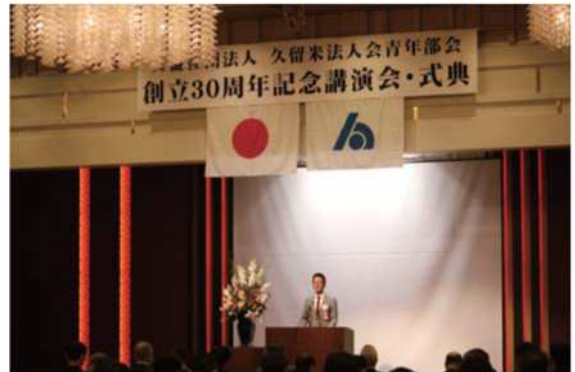
公益社団法人 久留米法人会青年部会 創立30周年記念講演会・式典