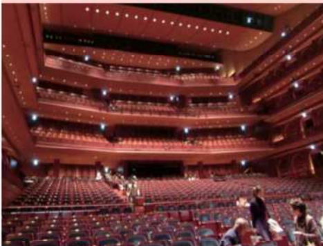
久留米シティプラザについて説明と見学