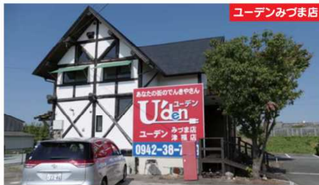
ユーデンみづま店

我が社の座右の銘は、【誠意】【勤労】【見識】【気魄】の精神で地域の為に貢献し頑張っています。