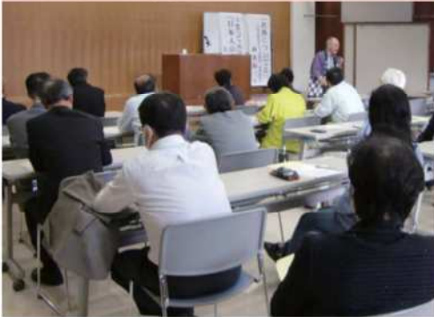
口演会「日本人の底力」