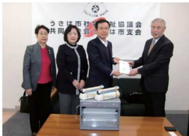
【平成28年12月15日(木)】 うきは市社会福祉協議会へ卓上シーラー2台と紫外線消毒器