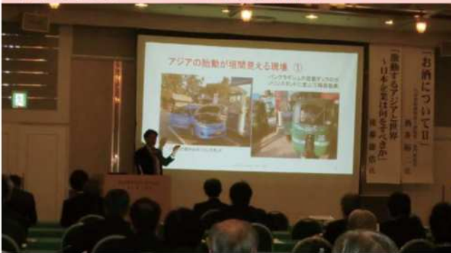
講演会「激動するアジアと世界 日本企業は何をすべきか」