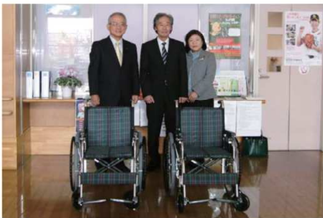
【平成28年12月16日(金)】 小郡市社会福祉協議会へ車椅子2台