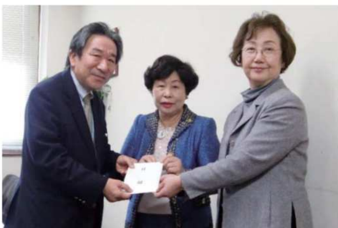
【平成28年12月1日(木)】 一般社団法人 生活支援センター結へ洗濯乾燥機

生活支援団体に洗濯乾燥機寄贈 久留米法人会女性部会 久留米市生活支援センターは、生活支援センターに洗濯乾燥機を寄贈した。写真：同部会は毎年開いているチャリティーバザーの売上金を商品に替え、社会福祉団体などに贈る活動を1997年から行っており、今年も11月に市内で食器や靴、自転車などを安価で販売した。同センターは高齢者や障害者、刑務所を出所した人などが住宅を借りる際の保証人になるなどの活動をし