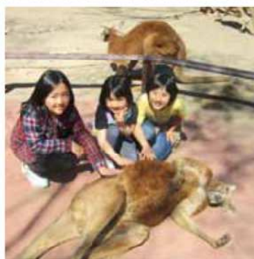
サファリパークにて行き倒れおじさんと?