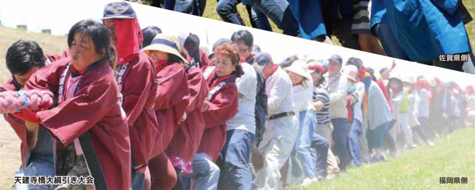
天建寺橋大綱引き大会