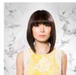
アリス=紗良・オット

開館記念を祝した「ウィーン・フィル」に続き、チェコを代表する世界トップクラスの「チェコ・フィル」を久留米に招聘。