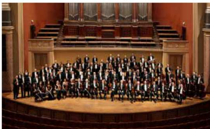
チェコ・フィルハーモニー管弦楽団