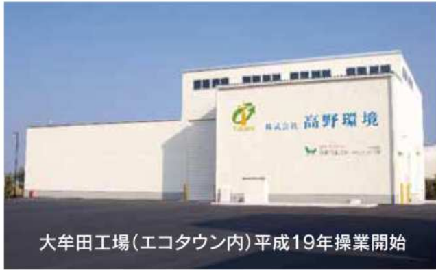
大牟田工場(エコタウン内)平成19年操業開始

当社は、父である先代社長が、昭和38年に創業しまして、私の代(昭和58年)に法人化しました。現在、産業廃棄物の収集運搬(九州一円)、産業廃棄物の中間処理(大牟田市)、一般廃棄物の収