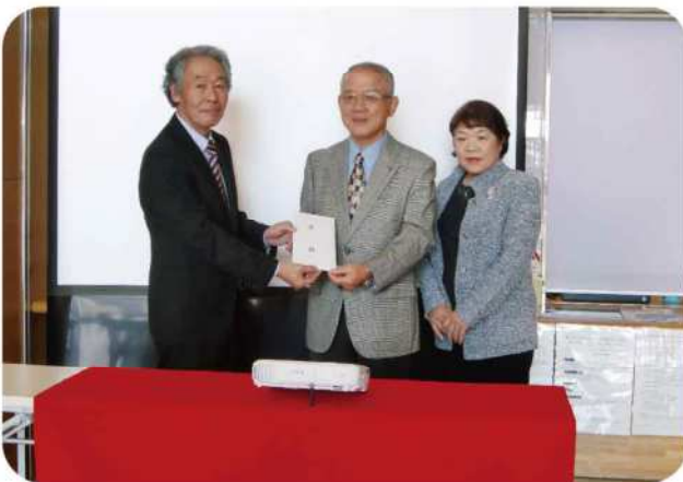
【平成29年12月15日(金)】 小郡市社会福祉協議会へプロジェクターとスクリーン