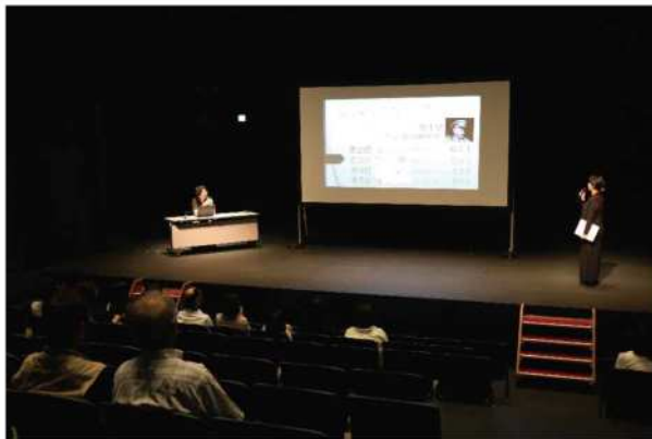
企業や団体の研修・講演会など(写真のスクリーンは183型)

3月10日(土) 10:00～ 出演：前川清、絃毅 会場：ザ・グランドホール 料金：6,000円、当日500円アップ