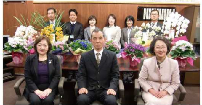
久留米税務署のみなさんと記念撮影

【平成30年2月6日(火)】女性部会では久留米税務署の確定申告会場へ平成5年から花鉢を寄贈しています。待ち時間に少しでも和んでいただければ幸いです。