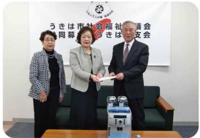
【平成29年12月8日(金)】 うきは市社会福祉協議会へエスプレッソマシン