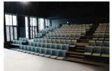
ブラインドを上げると開放的