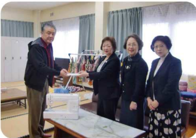
【平成29年12月5日(火)】 NPO法人共同作業所 さくらんぼへ電動ミシン