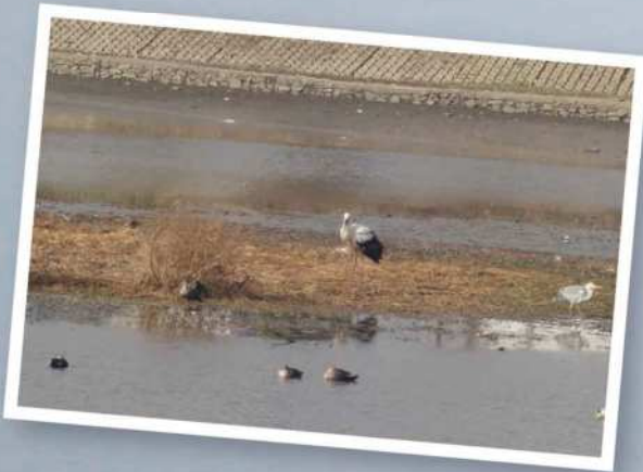
小郡にコウノトリ飛来