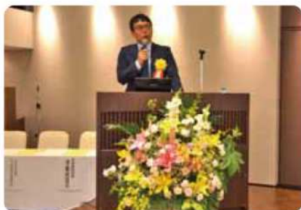
記念講演 上念 司 氏

全法連会長・福岡県連会長の表彰状伝達、久留米法人会会長表彰など滞りなく終了しました。また、総会前には記念講演会を開催しました。講師に経済評論家の上念司氏をお迎えして「これからの日本経済・景気を読み解く」のテーマでご講演いただきました。リフレ派の論客としての経済政策、外交防衛政策などについてはテレビ、ラジオなどでも活躍のとおりでした。