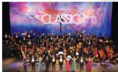
Presentation Licensed by Disney Concerts. ©Disney