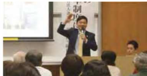
「元アナ市長のまちづくり実況中継!」加地良光氏(小郡市長)