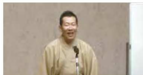
「木久蔵流、笑うが一番」林家木久蔵氏(落語家)