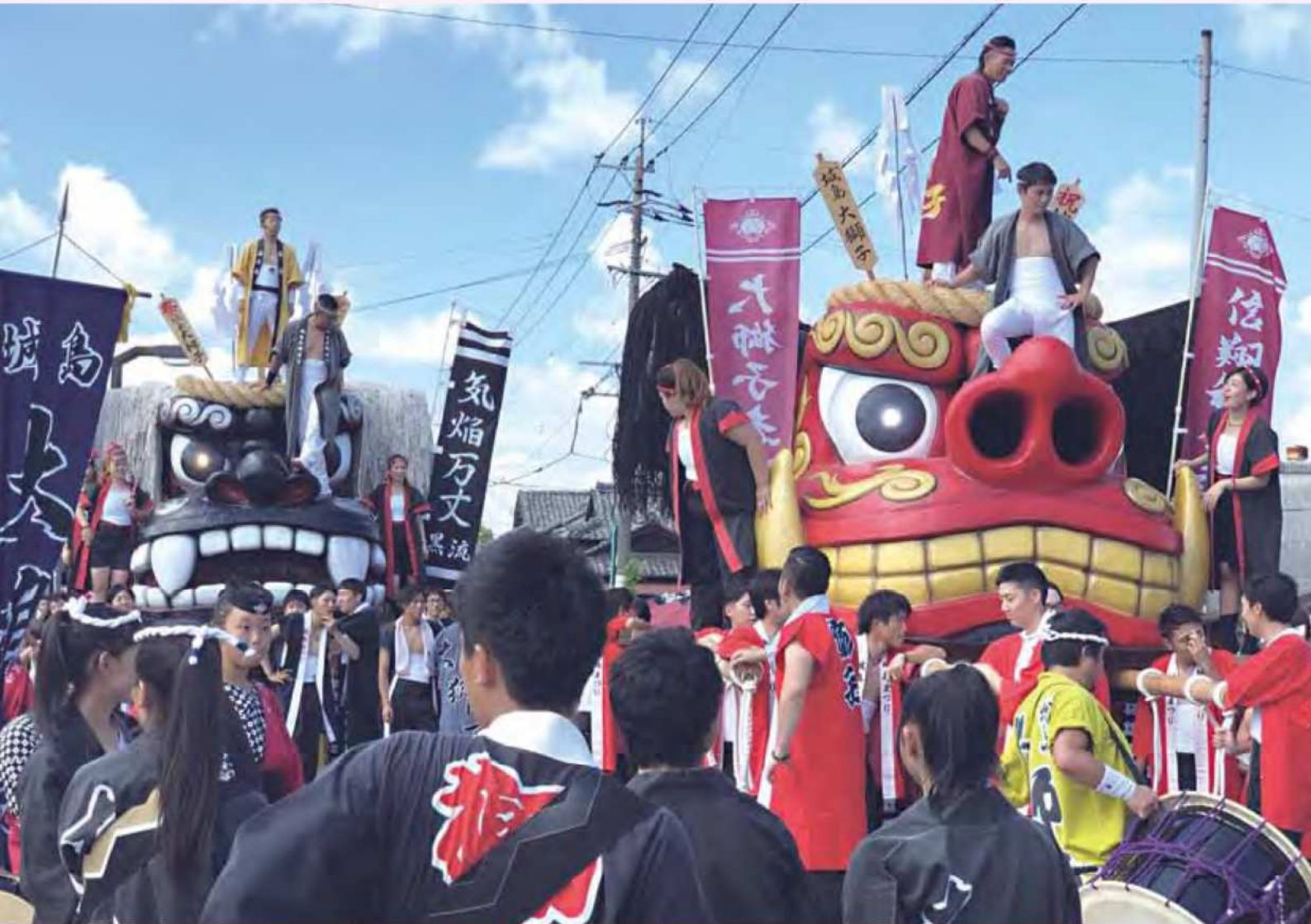
第46回城島ふるさと夢まつり(久留米市城島町) 9月15日・16日「大獅子&仮装パレード」では、高さ3メートル、全長35メートルの赤と黒の大獅子が練り歩きました。中でも2基の大獅子が通りを駆り抜けてタイムを競う「競い脚」は迫力満点です。