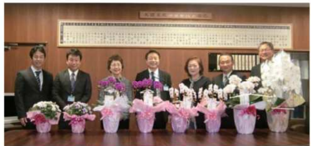
久留米税務署のみなさんと記念撮影