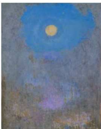
《八女の月》1969年 京都国立近代美術館蔵