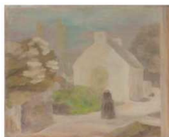
《ヴァンヌ風景》1923年 久留米市美術館蔵