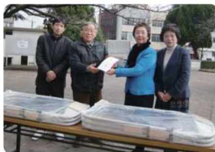
【平成30年12月17日(月)】 NPO法人ホームレス支援久留米越冬活動の会へ長机8台、パイプ椅子6脚