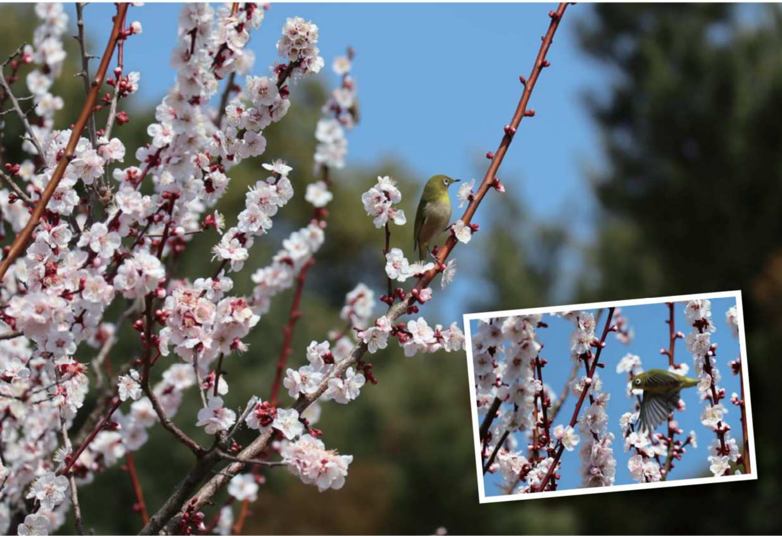
梅林寺にメジロ飛来