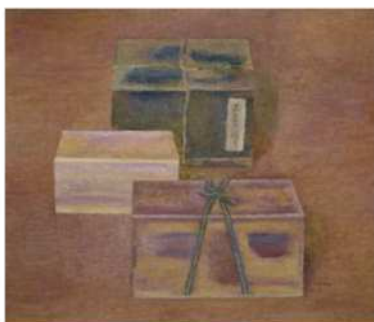
《箱》1959年 八女市蔵(久留米市美術館寄託)