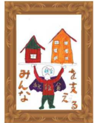
久留米税務署長賞