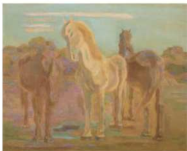
《放牧三馬》1932年 石橋財団ブリチストン美術館蔵

留学から帰国後、郷里久留米で描いた風景、八女に転居後に本格化した馬の作品を紹介します。