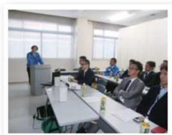
北原ウエルテック(株)