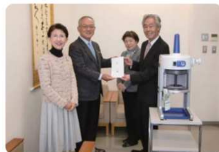
【平成30年12月11日(火)】 小郡市社会福祉協議会へ 電動かき氷機1台