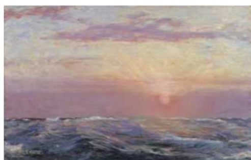
青木繁《朝日(絶筆)》1910年 佐賀県立小城高等学校黄城会蔵