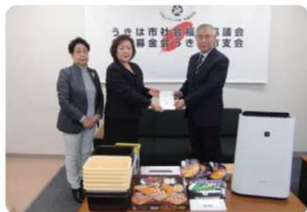
【平成30年12月7日(金)】 うきは市社会福祉協議会へ プロジェクター、空気清浄機等