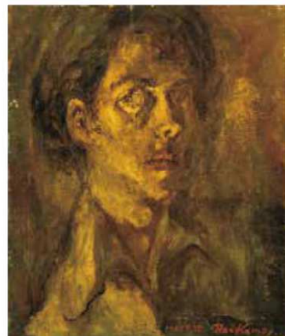
《夜(自画像)》1947年 笠間日動美術館