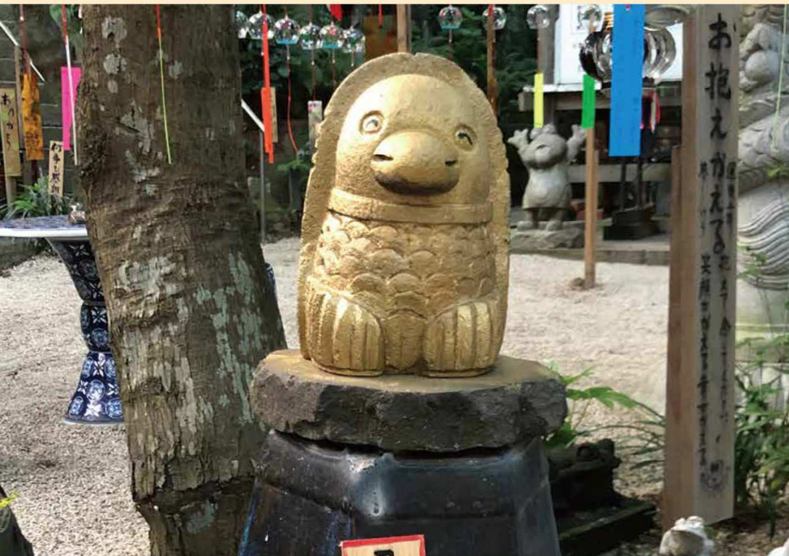
如意輪寺(かえる寺)の風鈴祭りとアマビエ

久留米シティプラザ ..... 2 久留米市美術館 ..... 4 ペーパーレス妨げる日本の商慣習とは ..... 6 税務署からのお知らせ ..... 7 不動産譲渡契約書等にかかる印紙税軽減措置とは? ..... 8