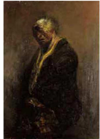
《私の村の酔っ払い》1973年 公益財団法人ひろしま美術館