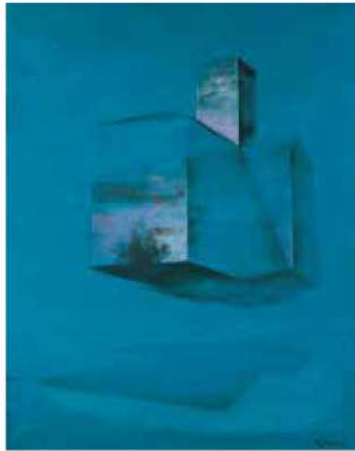
《教会》1976年 公益財団法人ひろしま美術館