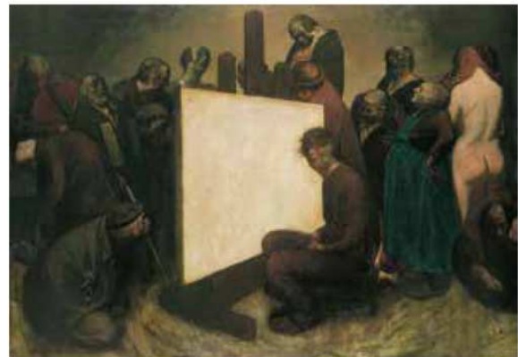
《1982年 私》1982年 石川県立美術館