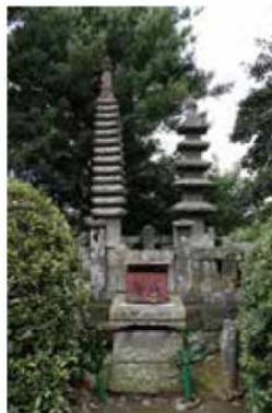
写真／上 全国総本宮 水天宮 写真／左 白鳥神社 (荒木町) 写真／右 平神社の平知盛の墓 (田主丸町)