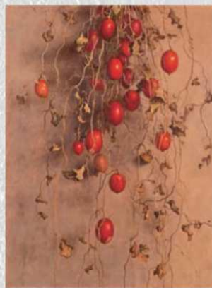
《からすうり》1935年 福岡県立美術館

第3章「戦前期」は、久留米の生家に戻ってから再び上京し、終戦を迎えるまでの時期で、近年発見された《からすうり》は生家の庭に建てた小さなアトリエで生まれました。赤い実がついた蔦が垂れ下がる構図は絶妙で、絵の技術に対する確かな自信が感じられます。