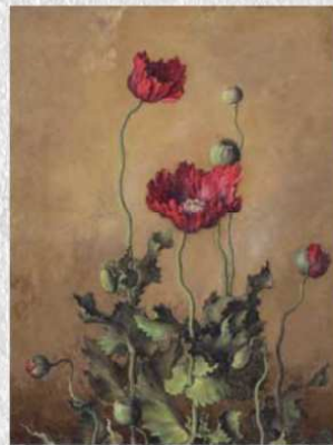
《けし》 1925年 三鷹市美術ギャラリー

会場の展示は5章に分かれ、「青年期」の章から始まります。野十郎は中学明善校を経て東京帝国大学農学部水産学科に進み、同科を卒業した後、念願だった画家の道に転じました。30代までには、茎をくねらせて上に伸びるように見える樹木や花、袈裟をまとう姿で鋭い視線を向ける自画像など、暗い色調に包まれた謎めいた雰囲気のある作品を残しています。