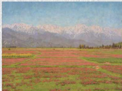
《れんげ草》1957年 個人蔵

さらに4章の「戦後期」は、終戦から亡くなるまでの30年間にあたります。この時期の風景画や静物画には、対象の細部まで緻密に描きながら構図にゆるぎない安定感がある、野十郎の写実のスタイルの完成を見ることができます。