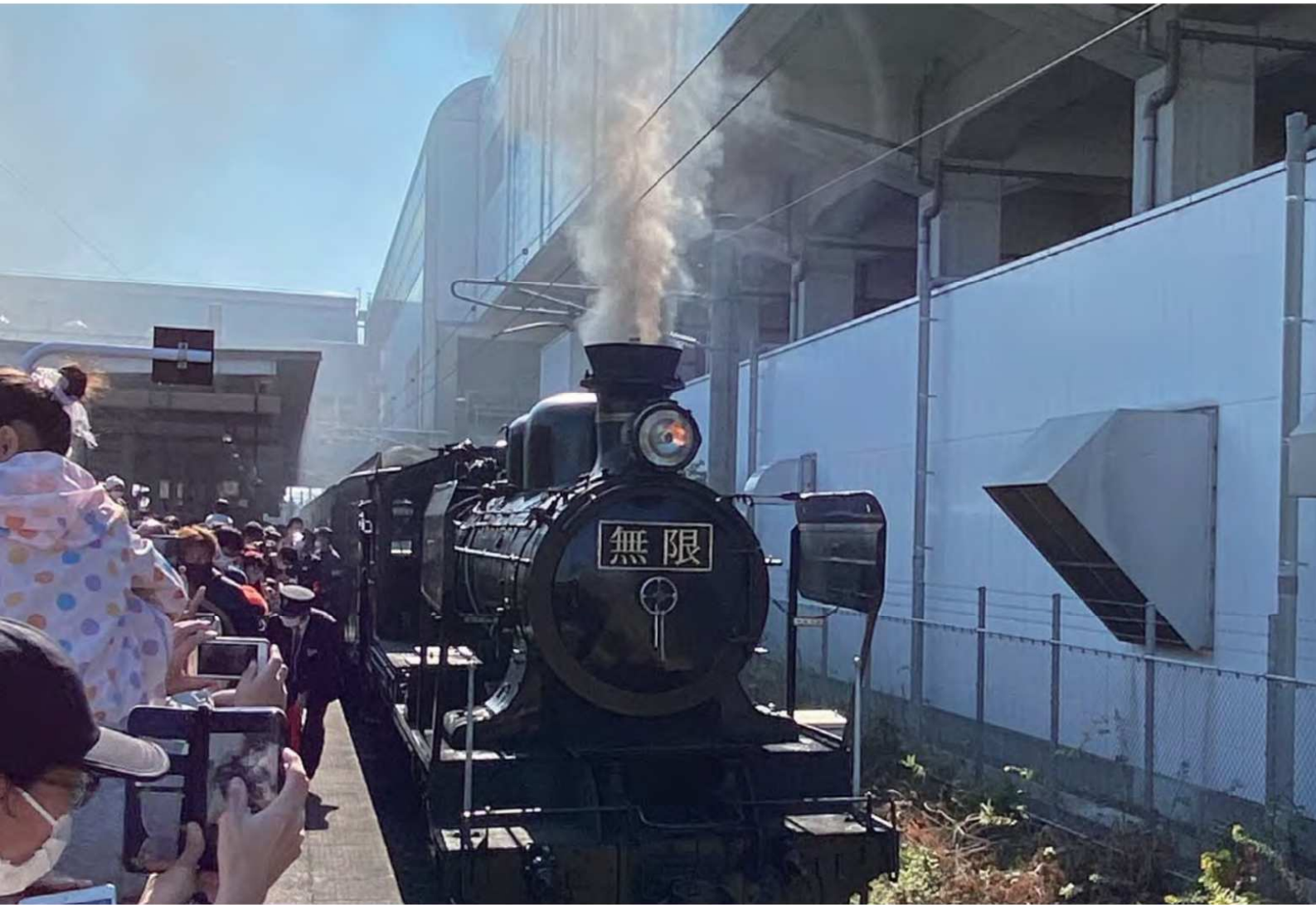
JR久留米駅に無限列車到着