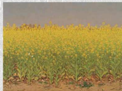
《菜の花》1965年頃 個人蔵