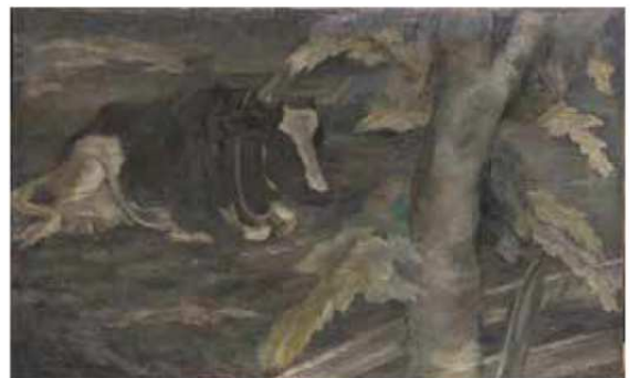
坂本繁二郎《牛》1920年 石橋財団アーティゾン美術館