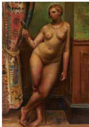
児島善三郎《鏡を持つ女》 1928年 東京国立近代美術館