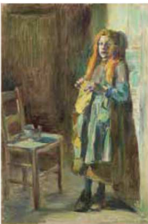
黒田清輝《ブレハの少女》 1891年 石橋財団アーティゾン美術館

今回の展覧会は、装飾古墳の昔から多彩な文化の混在のあった地の利、歴史、また、師弟間や友人間のつながりなどを通して、九州に生まれ、育った画家たちが大切に受け渡してきたものを辿ろうという試みです。手がかりは、黒や褐色といった「大地の色」と、生活実感ともいべき「ざらざらとした触感」です。明治から21世紀の今日まで、めまぐるしく変化する状況のなかで、思いを受け継ぎ、見る人を立ち上がらせるような、力強く大地に根ざした九州洋画の流れをぜひご覧いただきたいと思います。