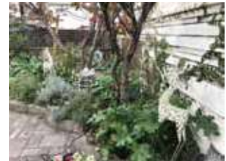
ガーデンイルミネーション