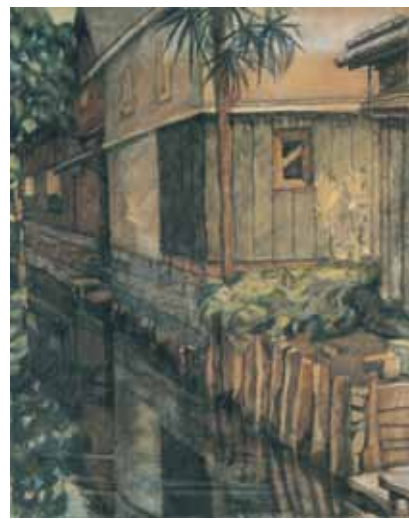
古賀春江《柳川風景》1914年

1914年の夏、古賀は松田と一緒に柳川へ写生に行きました。市の中に張り巡らされた水路が珍しかったのでしょう。家並みと掘割を斜めに捉えた構図で、画面の半分は穏やかな水面に揺らめく景色で占められています。