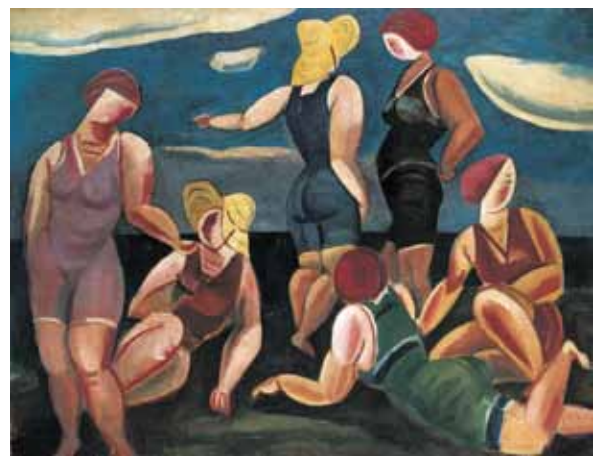
古賀春江《海水浴の女》1923年

太平洋画会や二科会など中央で入選を果たし、画家の道を歩み始めた頃の作品。松田自作の写真帖に「刈跡(黍殻積)東京大塚にて」と記載があり、黍の積み藁であることがわかっています。