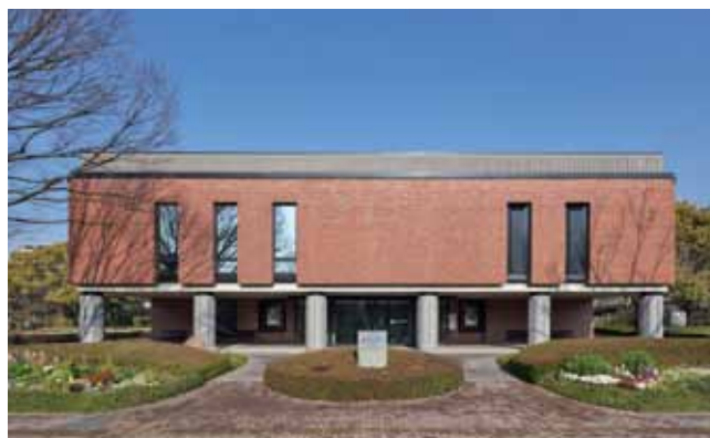
石橋正二郎記念館▶

石橋正二郎記念館は、2016年11月19日、久留米市美術館開館と同じ日に開館しました。石橋美術館は久留米市美術館に、そして石橋美術館別館は石橋正二郎記念館に変わったのです。石橋正二郎記念館では、株式会社ブリヂストンの創業者であり、石橋文化センターの建設寄贈者でもある石橋正二郎の文化的事績や石橋文化センターの歴史などを紹介しています。また展示室の一番奥には絵画展示コーナーもあります。