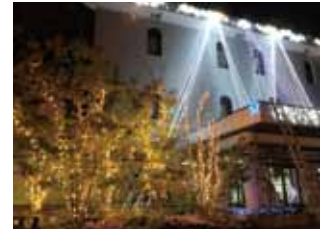
イルミネーション