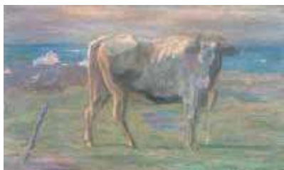
坂本繁二郎《海岸の牛》 1914年 北九州市立美術館蔵

青木の死後、坂本は二科会を活動の場とし、牛を繰り返し描きます。坂本の旅立ちは、青木からの旅立ちを意味します。3年間のフランス留学を経て故郷へ戻った坂本は、やがて八女に移り、馬、静物、月を題材に制作に没頭します。