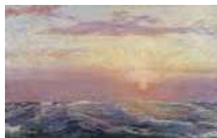
青木繁《朝日（絶筆）》1910年 佐賀県立小城高等学校同窓会黄城会 （佐賀県立美術館寄託） 佐賀県重要文化財