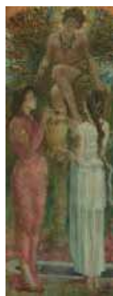
青木繁《わだつみのいろこの宮》1907年 石橋財団アーティゾン美術館蔵 重要文化財

1907年、文部省主催の展覧会（文展）に先がけて開催された東京勸業博覧会に、二人は渾身の作を出品します。青木は古事記に取材した《わだつみのいろこの宮》、坂本は伊豆大島の人々の日常に取材した《大島の一部》で勝負に出ます。三等賞という結果に失望した青木は美術界を批判し、父の病状が悪化したこともあり東京を離れます。一方、坂本は東京でひたすら画業に励みます。青木は、久留米に帰郷しても自暴自棄となり、1911年3月、肺結核のため28歳の生涯を終えます。青木の死によって、二人は別れを迎えたはずですが、坂本は生涯青木の顕彰に努めることとなります。