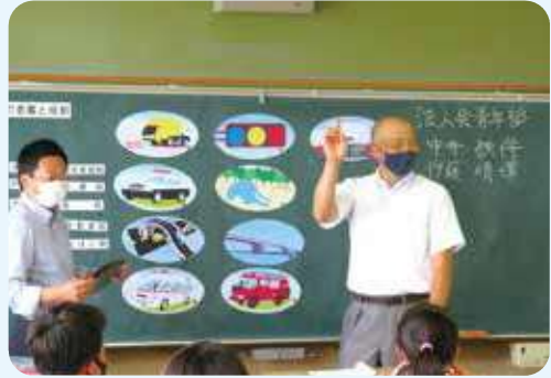
中井鉄併青年部会副会長