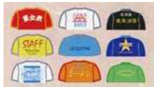
オリジナルTシャツ