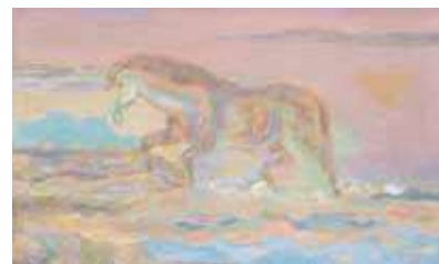
坂本繁二郎《水より上る馬》 1953年 株式会社鉄鋼ビルディング蔵