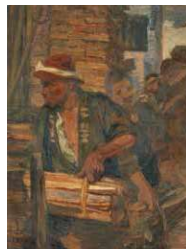
坂本繁二郎《町裏》 1904年 個人蔵