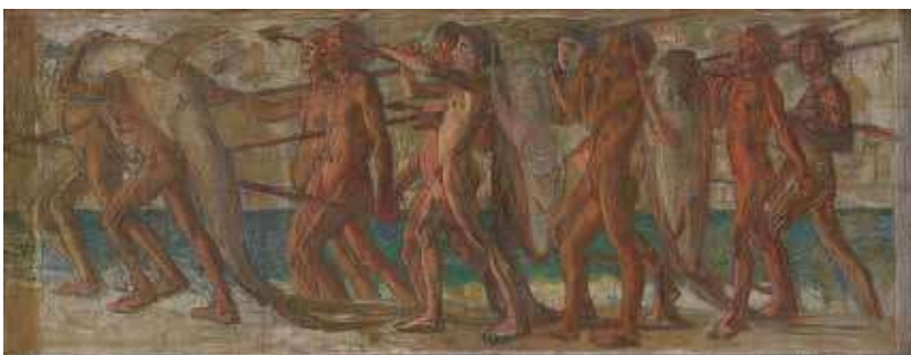
青木繁《海の幸》1904年 石橋財団アーティゾン美術館蔵 重要文化財