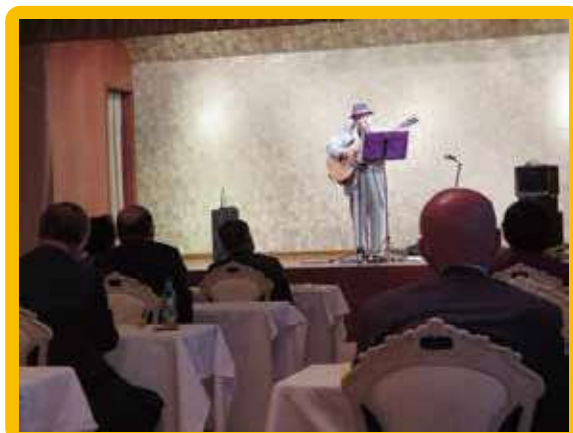
「ダニー馬場の方言おもしろ歌謡ライブ」