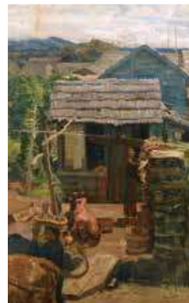
坂本繁二郎《大島の一部》 1907年 福岡市美術館蔵