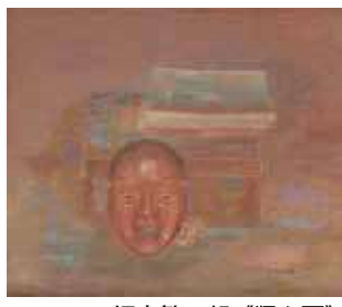
坂本繁二郎《狸々面》 1952年 個人蔵