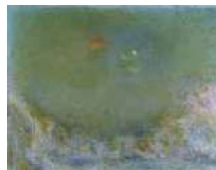
坂本繁二郎《幽光》1969年 石橋財団アーティゾン美術館蔵