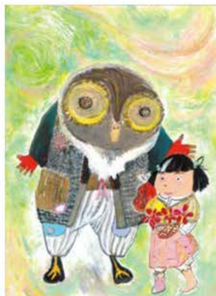
イラスト:倉持智行

小学生以下無料 (お席が必要なお子様は要チケット・要保護者同伴)、 中学生以上500円