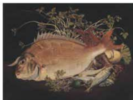
高橋由一《鯛(海魚図)》1879年頃 金刀比羅宮蔵

西洋の石版画の再現性の高さに驚愕した高橋由一は、その表現技法を自らのものにすべく奮闘しました。一方で、絵画は対象の形を写すだけにとどまらず「絵事ハ精神ノ為ス業ナリ」と精神性を重視しました。本展では、由一のように自身の精神性を表現する手段として写実を選んだ作家たちを紹介します。