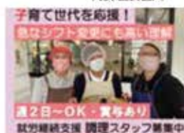
医療・介護・福祉施設 等