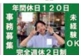
営業・飲食店・運送 等