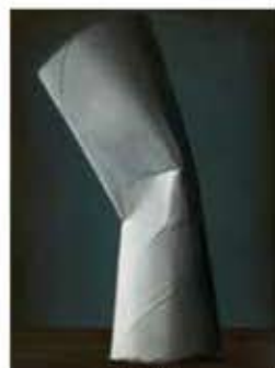
横山奈美 《逃れられない運命を受け入れること》 2016年 gigei10蔵