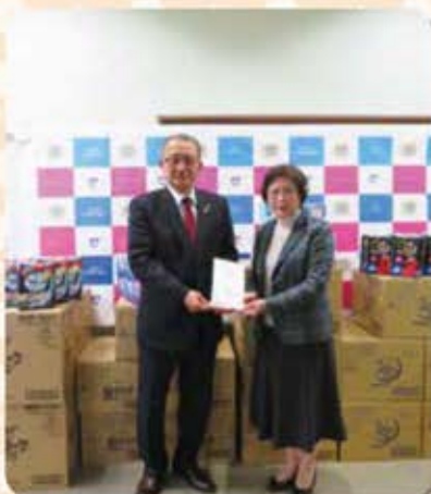
令和4年12月19日 久留米市社会福祉協議会 生理用ナプキン