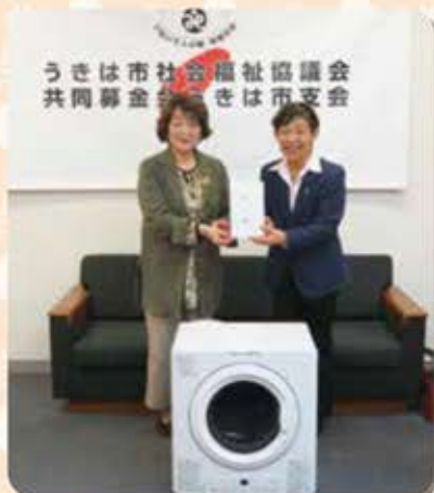
令和4年12月8日 うきは市社会福祉協議会 ガス衣類乾燥機