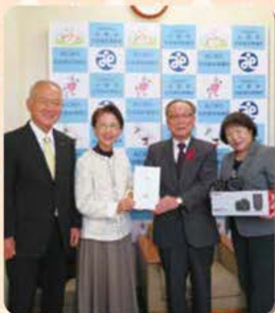
令和4年12月16日 小都市社会福祉協議会 一眼レフデジタルカメラ1台