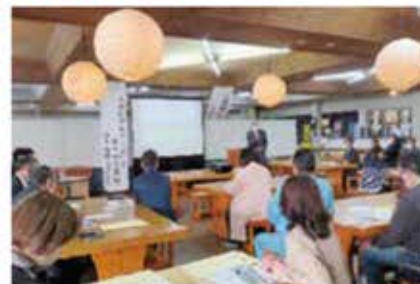
高木典雄うきは市長