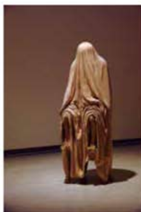
七瀬綾乃 《rainbows edge XIV》2021年 作家蔵