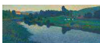
斎藤豊作《夕映の流》1913年 東京国立近代美術館