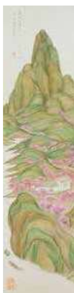
夏目漱石《青嶂紅花園》 1915年 岩波書店 *3期