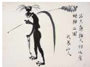
芥川龍之介《水虎晚帰之図》1923年 山梨県立文学館 *1期