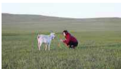
「山羊を抱く／貧しき文法」