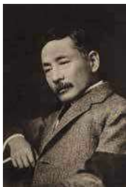
夏目漱石 『漱石の思ひ出』 (1928年)より