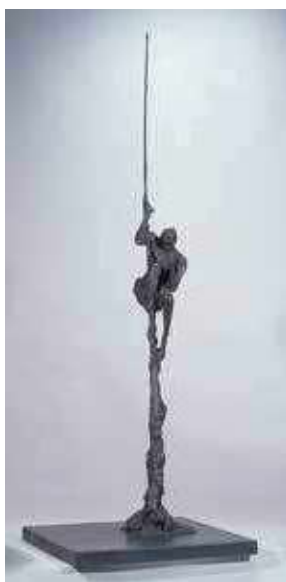
清水良治《蜘蛛の糸 (芥川龍之介より)》2004年 石川県立美術館