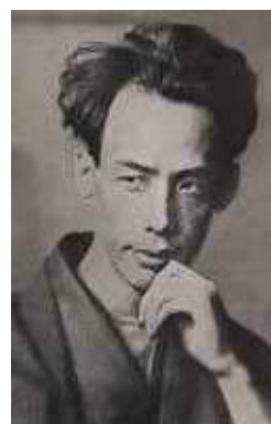
芥川龍之介 『日本文学アルバム6 芥川龍之介』 (1927年)より