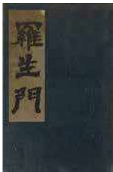
芥川龍之介『羅生門』 (阿蘭陀書房、1917年) みやこ町歴史民俗博物館