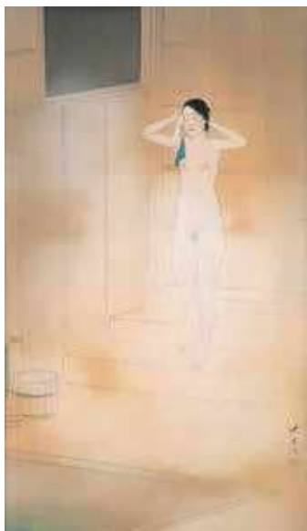
松岡映丘《湯煙(草枕)》1928年 練馬区立美術館寄託 *1期

芥川が折に触れて美術鑑賞や観劇に出かけていたことは、友人たちに感想を書き送った手紙や、自作の小説の中からうかがうことができます。当時の美術界に関していえば「文展」に加えて「二科会」や「フェウザン会」など様々な団体が生まれ、画家たちがそれぞれの表現を模索していました。必ずしも万人に受ける作品を褒めない芥川の姿勢は、師の漱石とよく似ています。本展では芥川が見つめた美術品や、漱石や芥川の小説にインスパイアされた絵画・彫刻、さらに、彼らが自ら筆をとった水彩画やスケッチなどを紹介します。