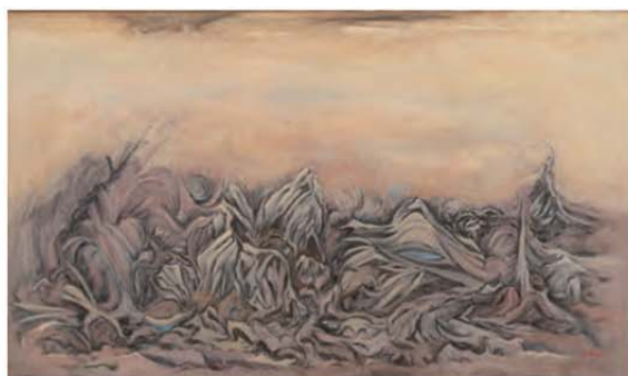
《一筑後川よりー朝羽大橋(上側)》1987年 個人蔵