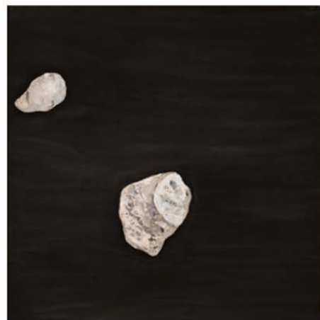
《存在の意》1993年 個人蔵