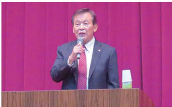
高江久留米第7支部長