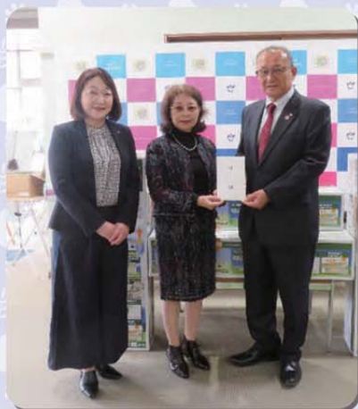
令和5年12月7日 久留米市社会福祉協議会 テント7張り