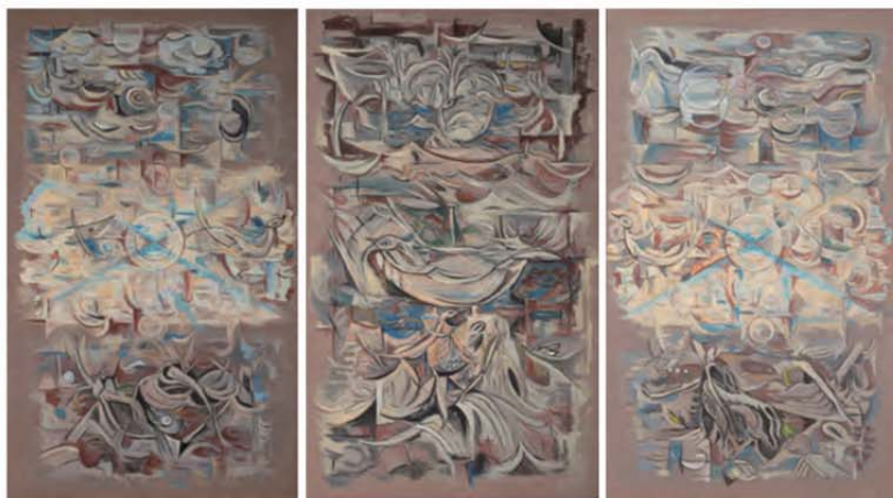
《筑後川三部作 天水地》1988年 個人蔵