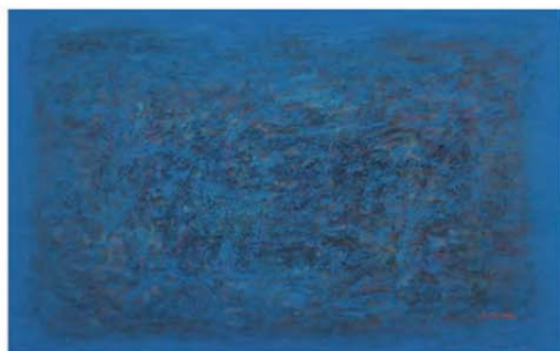
《海よりの風景》1993年 個人蔵