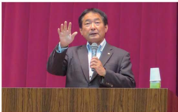
原口新五久留米市長