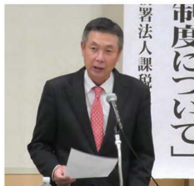
鳥越久留米第3支部長