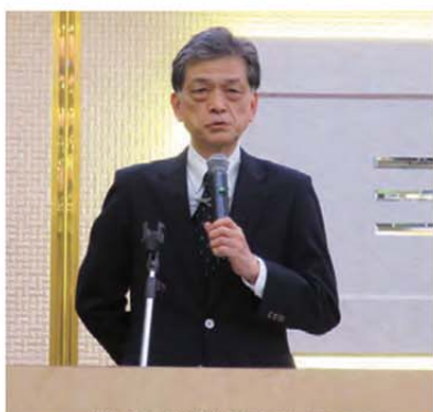
本間久留米第2支部長