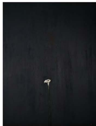
《花に語る》2010年 個人蔵