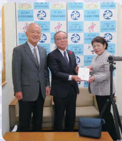
令和5年12月19日 小郡市社会福祉協議会 ビデオカメラ1式