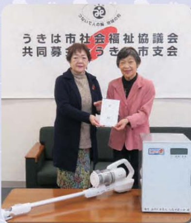
令和5年12月11日 うきは市社会福祉協議会 食品乾燥機・掃除機