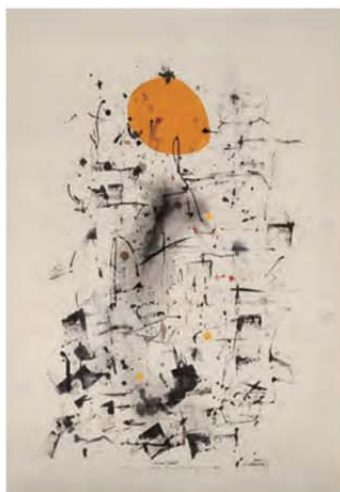
《「山上にて聞きしこと」リスト交響詩第1番》 1997年 個人蔵