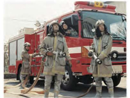
写真集「浅田家」より

久留米シティプラザの館内オープンスペースでアーティストと市民がつくりあげる写真展示プロジェクトが2024年よりスタート。今回のアーティストとして、写真家・浅田政志さんをお迎えし、「わたしとくるめ」と題した写真展を2025年3月に開催します。浅田さんは、家族と「消防士」や「ロックバンド」などになりきって撮影した写真集『浅田家』で広く知られるほか、さまざまな家族や子どもたち、まちの人々を被写体にした「演出写真」を手掛けてきました。「わたしとくるめ」は、久留米の名物や伝承などについて公募したエピソードを、浅田さんならではの演出により写真で再現するものです。「わたしとくるめ」のキックオフイベントとして、この4月にワークショップとトークイベントを開催します。