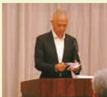
高橋税務署長祝辞