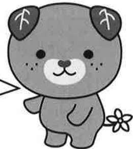
愛媛県イメージアップキャラクター みきやん

貴社にお勤めで、障がいを克服し職業人として活躍されている障がい者の方をご推薦ください。