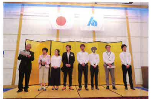
▲支部毎の入会者紹介と自社PRの様子