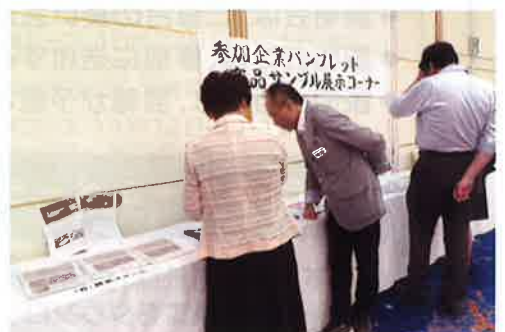
▲参加企業がPRできる展示コーナー