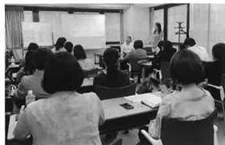
▲女性活躍のためのMMCセミナー風景