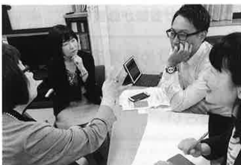
▲ワークショップ風景

次回は10月17日にセミナーを開催します。セミナーのお申込み方法と詳細はホームページにてお知らせします。ぜひご参加ください。