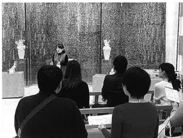
▲昨年度の異業種交流会(アロマバスソルト作り)の様子