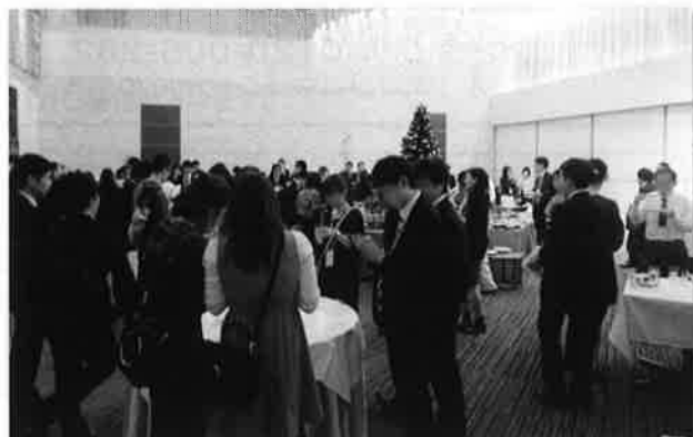
▲昨年度の異業種交流会(パーティ)の様子