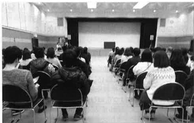
▲昨年度の異業種交流会(セミナー開催)の様子

内容、詳細はえひめ結婚支援センター岡崎・石井(Tel:089-933-5596、メール:office@msc-ehime.jp)にお問合せください。