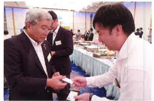
▲大塚会長との名刺交換

今後、各支部でも独自の異業種交流会や研修会、その他催しが開催されます。ご案内の折には、ぜひご参加ください。