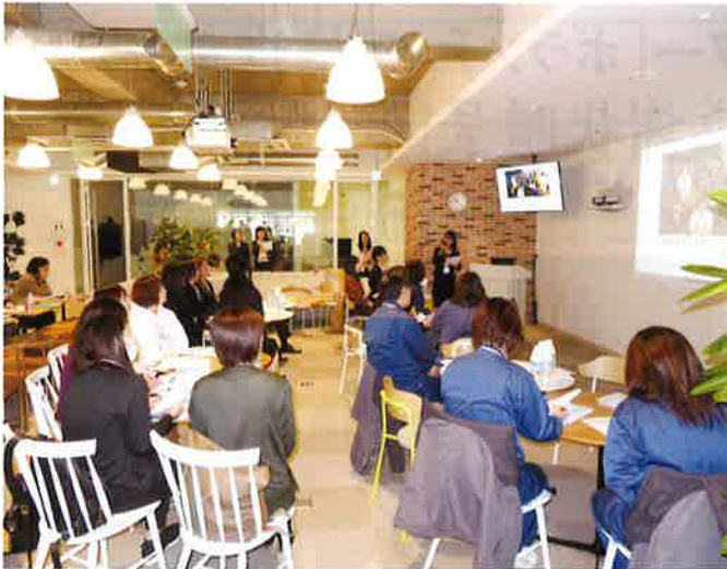
ひめボスブラッシュアップ事業全体発表会事業所 (株)アルティザン (有)佐々木組 同前工業(株) (株)TKPコミュニケーションズ 松山リレーションセンター (株)ファインデックス

愛媛県では、女性人材の育成等を通じて女性活躍推進や地域活性化を図り、女性を応援する県No.1を目指しており、愛媛県法人会連合会が受託し事業を展開しております。