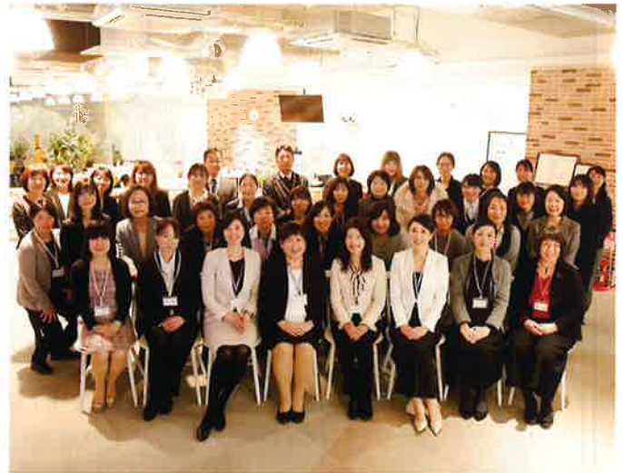
ひめボスマンター制度推進モデル事業全体発表会事業所 (株)ケアジャパン (福)Sign (行)自動車事務センター (公財)松山市男女共同参画推進財団 (株)ヤツツカ