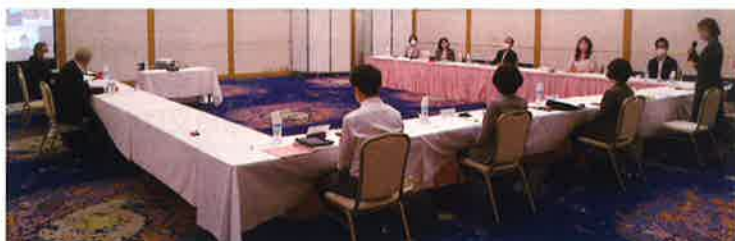
対面式とZOOMを併用しワーキンググループのキックオフ会を開催 (10月16日 於:東京第一ホテル松山)

県下約1,200社の事業所と県在住の労働者300人を対象に、10月下旬よりアンケート調査を開始しました。