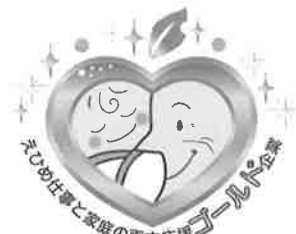
■ 認証マーク (ゴールド企業)