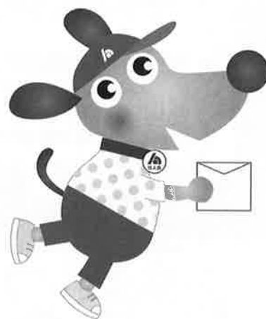
けんた 【法人会マスコットキャラクター】

(公社)松山法人会 事務局 〒790-0067 松山市大手町2丁目5-7 愛媛中小企業指導センター内 TEL:089-941-7711 FAX:089-947-4251