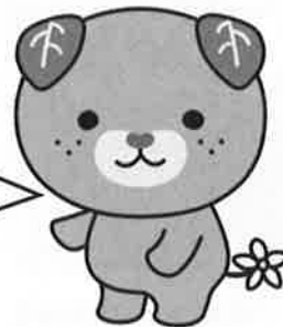
愛媛県イメージアップキャラクター みきやん

貴社にお勤めで、障がいを克服し職業人として活躍されている障がい者の方をご推薦ください。