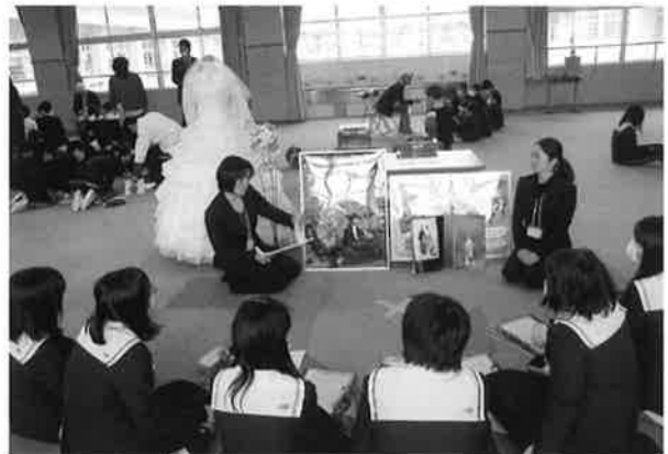
▲過去の夢きらきらプログラムの様子