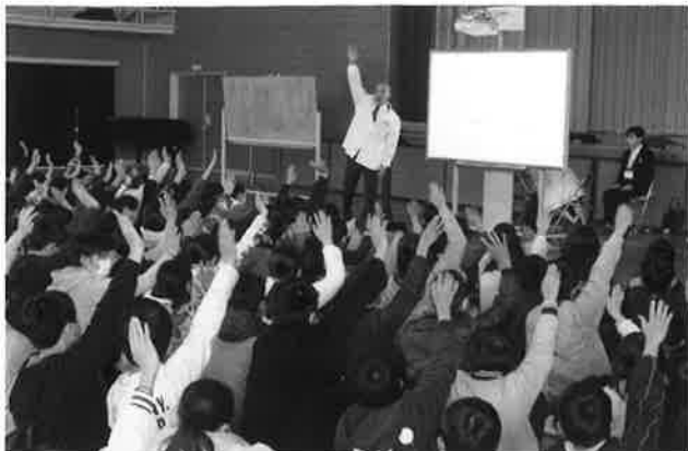
▲過去の租税教室の様子

コロナ禍で少しでも活動を行うことができるよう、青年部会らしくできることを進めてまいります！