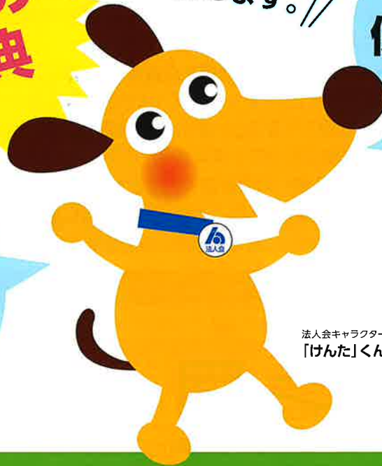
法人会キャラクター 「けんた」くん