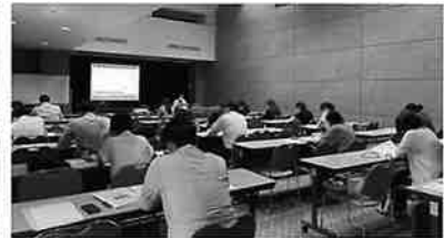
▲「社会保険実務コース」の開催風景