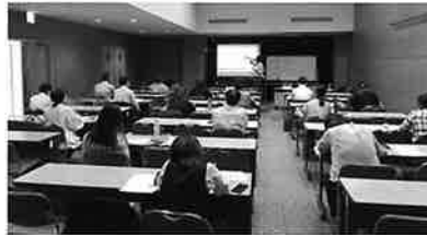
▲「会計実務コース」の開催風景

今年度も、感染症予防対策をとりながらの会場開催と現地出席が難しい方のためのZOOMによるオンライン同時配信により、会場へ来られなくてもインターネットの環境があれば、自社で受講が可能となるよう基礎的な内容を1日に凝縮し開催しました。